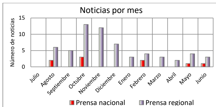
Gráfico 1: Noticias, distribuidas por meses, recogidas en los periódicos nacionales y regionales para el Parque Nacional de Monfragüe. Julio 2017-Junio 2018.