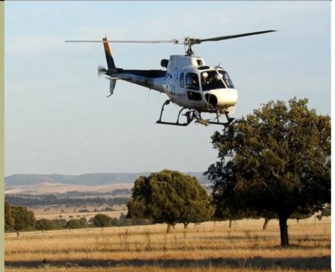
Helicóptero camino del Brezoso 21 de Junio de 2019