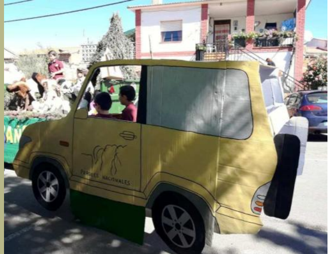
Carroza en la romería de San Isidro en Horcajo de los Montes

Próximos eventos: Eclipse Lunar y Observación Solar en Cabañeros