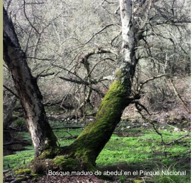
Bosque maduro de abedul en el Parque Nacional

Nueva publicación: Vegetación y flora del Parque Nacional de Cabañeros. Vol II