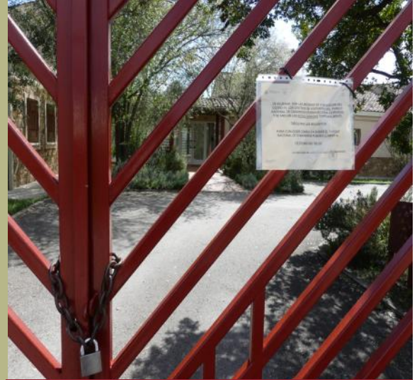
El Parque Nacional de Cabañeros cierra sus puertas de manera temporal