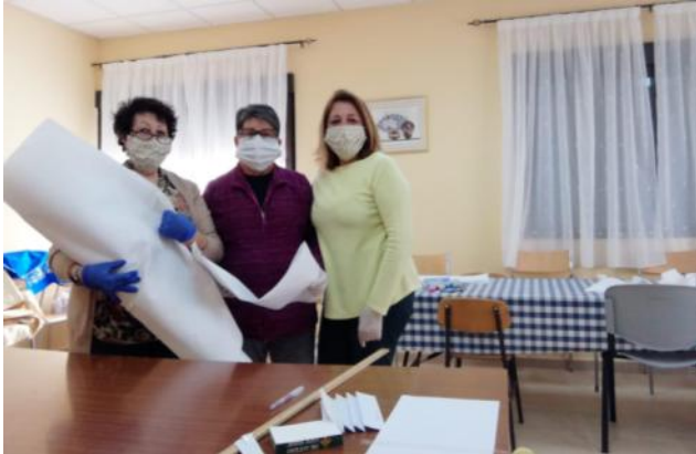
Asociación de Mujeres Saleras.

También agradecer el buen trabajo de la Asociación de Mujeres Saleras del municipio de Los Navalucillos, que están confeccionando mascarillas destinadas a protección civil, así como para comercios. ¡Llevan ya 640!