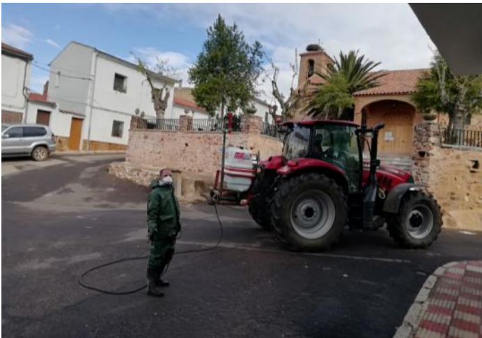
Desinfección en Alcoba.

A continuación exponemos solo algunas de las muchas iniciativas de las que nos hemos hecho eco y que se están produciendo en nuestro entorno más cercano: