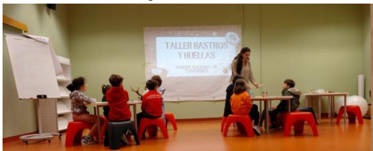
Taller de huellas y rastros / Aventuras Cabañeros

Durante el mes de noviembre se desarrolló un ciclo de ponencias en la biblioteca pública de Ciudad Real sobre diferentes temáticas de Cabañeros, acercando nuestra historia a la capital de provincia.