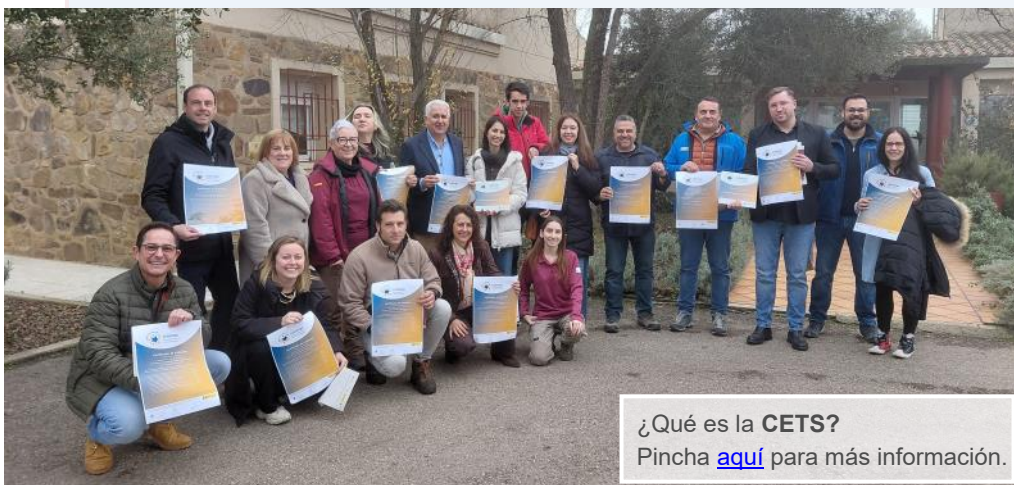
Acto de acreditación de empresas