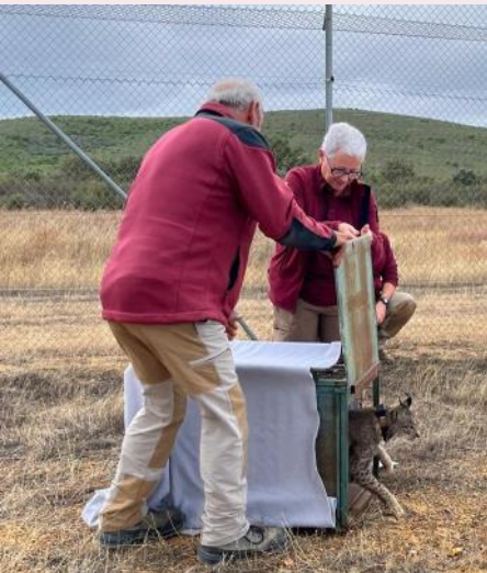
Suelta de Uvita (Lynx pardinus)