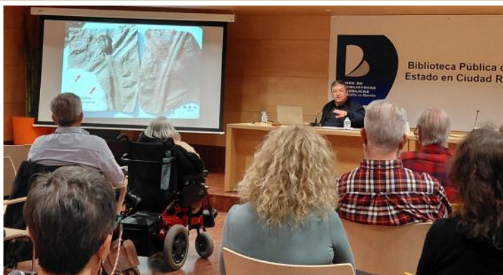
Ponencia "Cabañeros Sumergido" / J. Carlos Gutiérrez