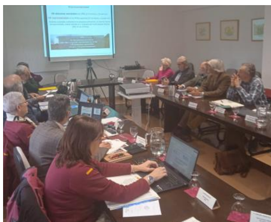
Sesión de Patronato / PNC

El pasado 4 de diciembre tuvo lugar la celebración del segundo pleno del Patronato celebrado este año. Algunos de los temas que se abordaron fueron el plan de actividades del parque, las subvenciones para el área de influencia socioeconómica, los hechos más destacados en la Red de Parques Nacionales y el convenio de colaboración entre el OAPN, la JCCM y los propietarios de terrenos dentro del parque, entre otros.