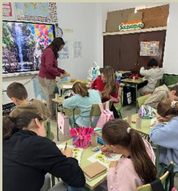
Taller de nidos en CRA San Isidro

¡Muchas gracias por compartir con nosotros este hito histórico!