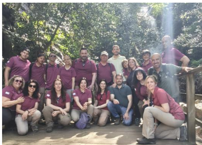
Jornadas de trabajo UP / PNC