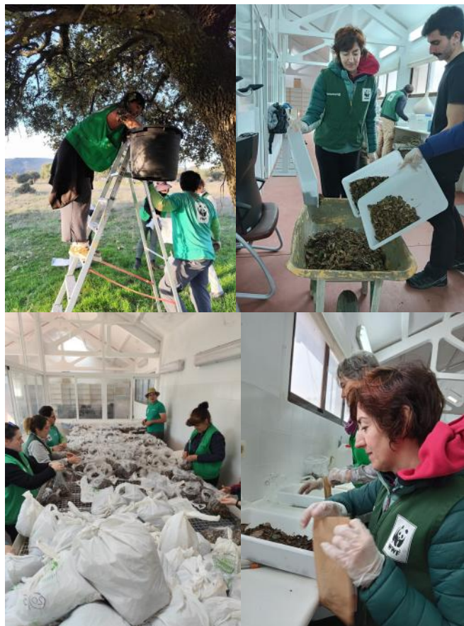
Voluntariado en el PNC

Más allá del trabajo de campo, el programa ofrece una experiencia integral que incluye actividades de formación y conocimiento del entorno. De este modo, los voluntarios no solo contribuyen a la mejora del ecosistema, sino que profundizan en los valores naturales y la biodiversidad que hacen de Cabañeros un lugar único.