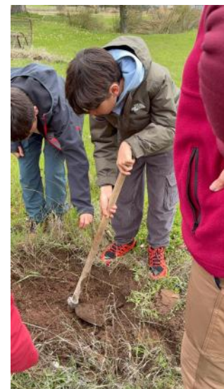
Jornada de plantación / PNC

Los participantes, pala en mano, trabajaron en la recuperación de zonas específicas plantando ejemplares de fresnos (árboles típicos de las zonas con humedad, que proporcionan una sombra generosa y refugio a multitud de