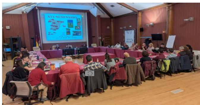
XVI Seminario Uso Público / OAPN

Asimismo, el pasado 20 de abril el equipo de Uso Público del Parque Nacional de Cabañeros se reunió durante una jornada de trabajo y convivencia. Este encuentro sirvió para poner en común nuevas ideas y evaluar las actividades realizadas hasta la fecha, trabajando siempre en la mejora constante de la experiencia de los visitantes en el territorio.