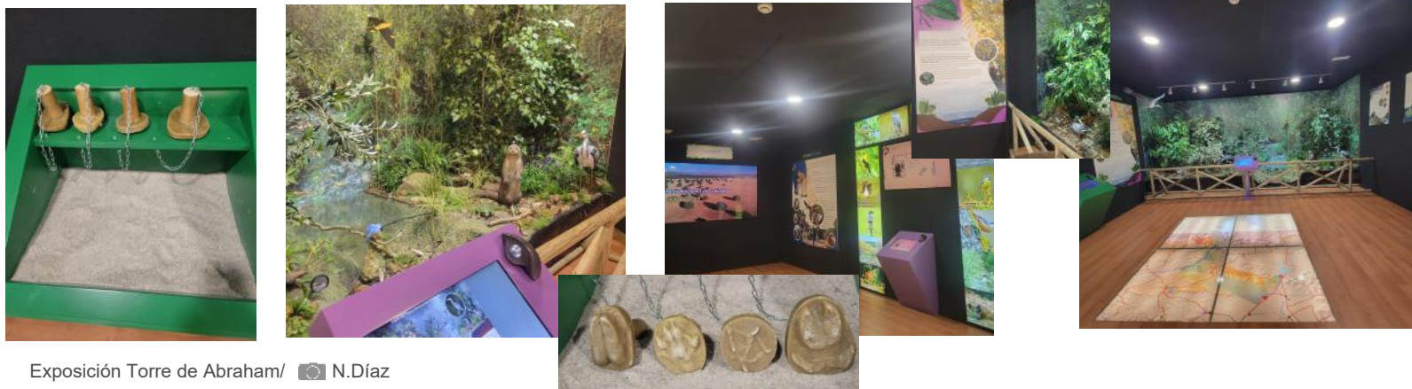
Exposición Torre de Abraham/ N.Díaz

Con estas mejoras Torre de Abraham se consolida como un espacio de aprendizaje sobre los valores naturales del Parque Nacional de Cabañeros.