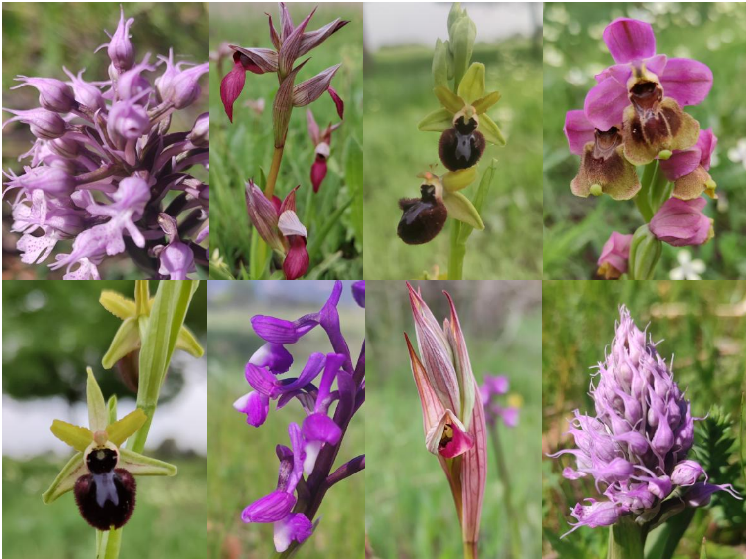
Orquídeas en el Centro de Visitantes "Casa Palillos" / 📍 V. de Lamadrid