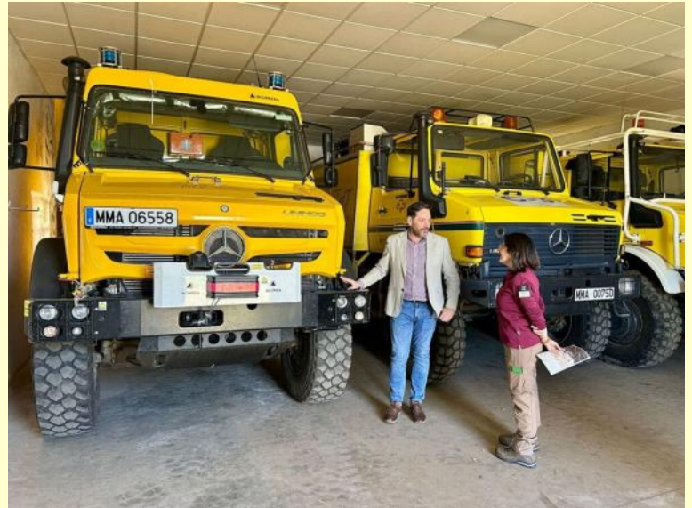
Presentación camión contra incendios

Con esta colaboración entre la dirección del parque y la administración central, Cabañeros se afianza como un referente en la gestión de espacios naturales protegidos.