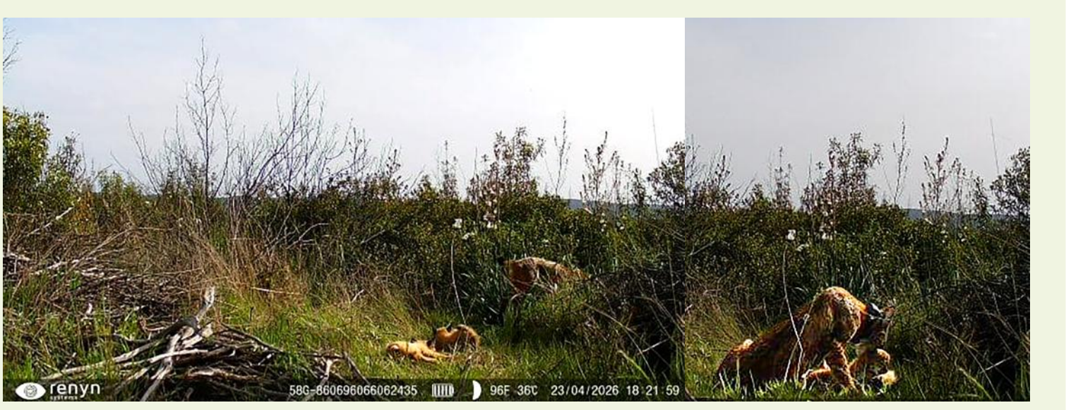
Uvita y sus cachorros

Gracias a las técnicas de fototrampeo y radioseguimiento, el equipo técnico pudo constatar el contacto entre ambos ejemplares a principios de diciembre de 2024 y desde el 12 de marzo del presente año, el marcaje de posiciones en la misma ubicación hicieron sospechar de la existencia de cachorros.