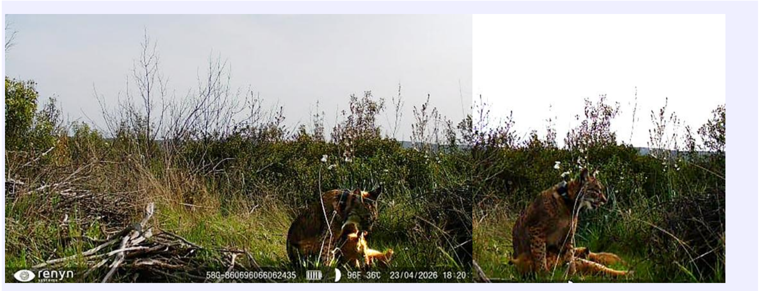
Uvita y sus cachorros

A pesar de las dificultades del terreno (zonas de difícil acceso y escasa cobertura para el envío de datos), finalmente se han obtenido las imágenes que confirman la presencia de los cachorros.