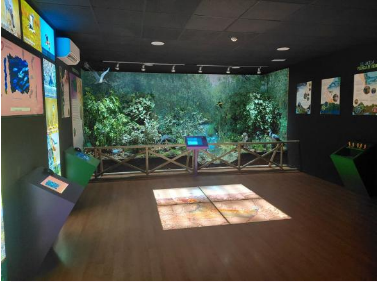
Centro de Visitantes Torre de Abraham

TORRE DE ABRAHAM SE CONSOLIDA COMO UN ESPACIO DE APRENDIZAJE SOBRE LOS VALORES NATURALES DEL PARQUE NACIONAL DE CABAÑEROS.