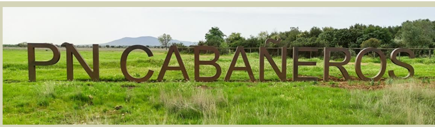
Señalética con las siglas PN CABAÑEROS

A partir de ahora, tu llegada al Centro de Visitantes Casa Palillos cuenta con una nueva parada obligatoria. No se trata simplemente de un cartel de bienvenida; es una invitación a mirar nuestro entorno de una forma diferente. Se ha procedido a la instalación de un nuevo elemento visual —una cuidada señalética con las siglas PN CABAÑEROS— diseñada específicamente para integrar al visitante en el paisaje. La ubicación y el diseño de estas letras no son casuales: su estructura funciona como una ventana abierta a la inmensidad de la raña, permitiendo que la luz y el horizonte se filtren a través de ellas.