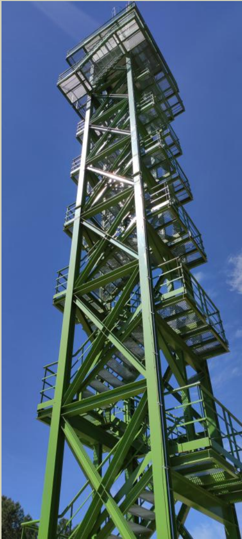
Torreta de vigilancia de Las Llanas / PNC

La instalación de nuevas torretas de vigilancia (cerca del centro de visitantes Casa Palillos y en Las Llanas) responde a la necesidad de una detección precoz, el factor más determinante para evitar que un fuego se descontrole. Estas estructuras, situadas en enclaves geográficos dominantes, permiten una cobertura visual de 360 grados sobre nuestros ecosistemas. La renovación de estas torres no solo mejora la ergonomía y seguridad del personal de vigilancia, sino que también integra tecnología de precisión para la triangulación de columnas de humo. Gracias a estos "ojos" permanentes, el tiempo de respuesta desde que se avista el primer rastro de humo hasta que los medios aéreos y terrestres reciben las coordenadas exactas se reduce al mínimo.