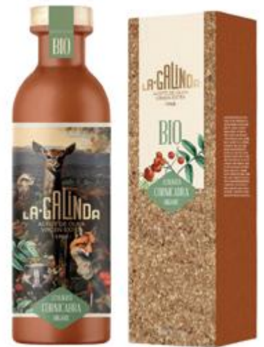
Aceite La Galinda Coop. San Miguel

La Galinda lleva el nombre de Cabañeros fuera de nuestras fronteras, demostrando que la sostenibilidad es el mejor camino para garantizar el relevo generacional y la creación de empleo en nuestras zonas rurales.