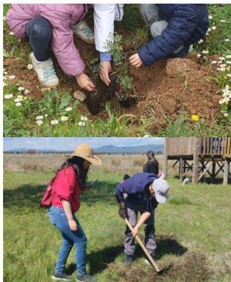
Jornada de plantación / PNC

EL PARQUE NACIONAL DE CABAÑEROS SE SUMÓ UN AÑO MÁS A LA CELEBRACIÓN DE L DÍA INTERNACIONAL DE LOS BOSQUES CON UNA JORNADA DE PLANTACIÓN