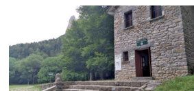
Pradera de Ordesa