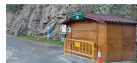
Aparcamiento de San Úrbez. Cañón de Añisclo