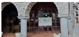
Plaza Mayor, 7. 22350. Bielsa. Tel. 974 50 10 43

Abierto todos los días en horario ininterrumpido de 8:00 a 17:00 h.