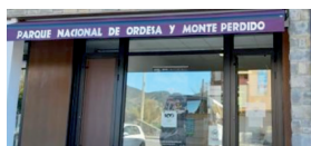
Avda. Pineta. Ed. Portal de Añisclo, 9. 22363. Escalona. Tel. 974 50 51 31

Abierto de 9:00 a 14:00 y de 16:15 a 19:00 h.