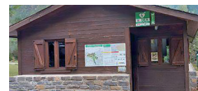
Pradera de Pineta. Inicio pista de La Larri