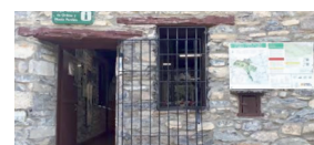
C/ Única, s/n. 22362. Escuaín. Tel. 974 94 15 60