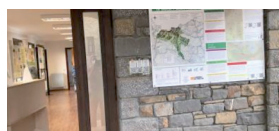
C/ Iglesia, s/n. 22375. Fanlo. Tel. 974 94 81 50