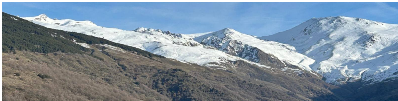
Cara sur y Picón de Jérez 20-1-25