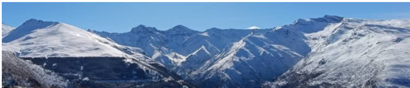
Vertiente norte de la Alcazaba al Veleta 20-1-25