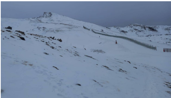
Mulhacén y Veleta 22-12-25