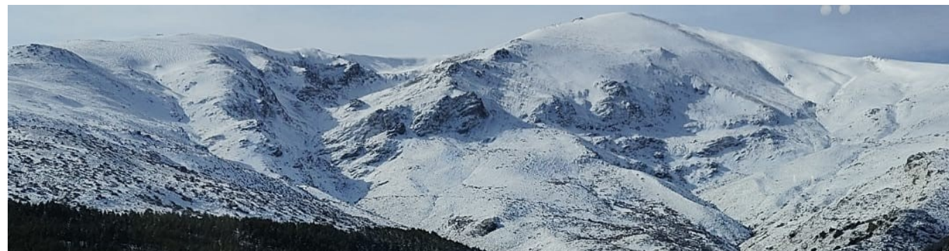
Picón de Jérez 22-12-25