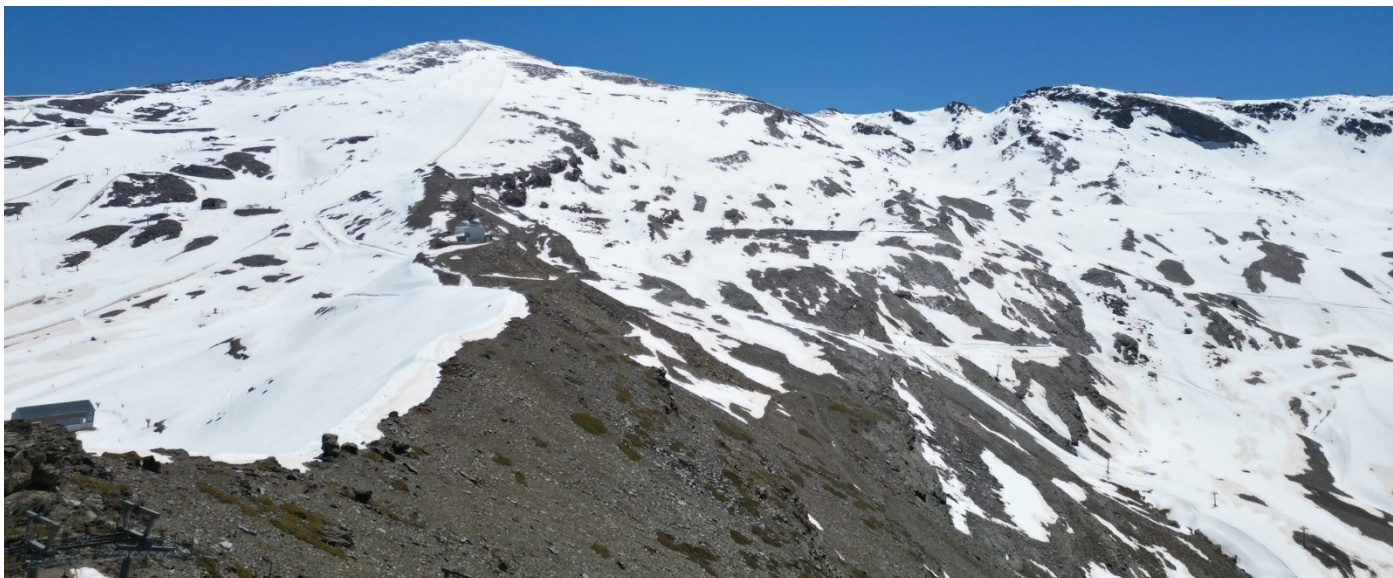
Veleta y Tajos de La Virgen 24-4-24