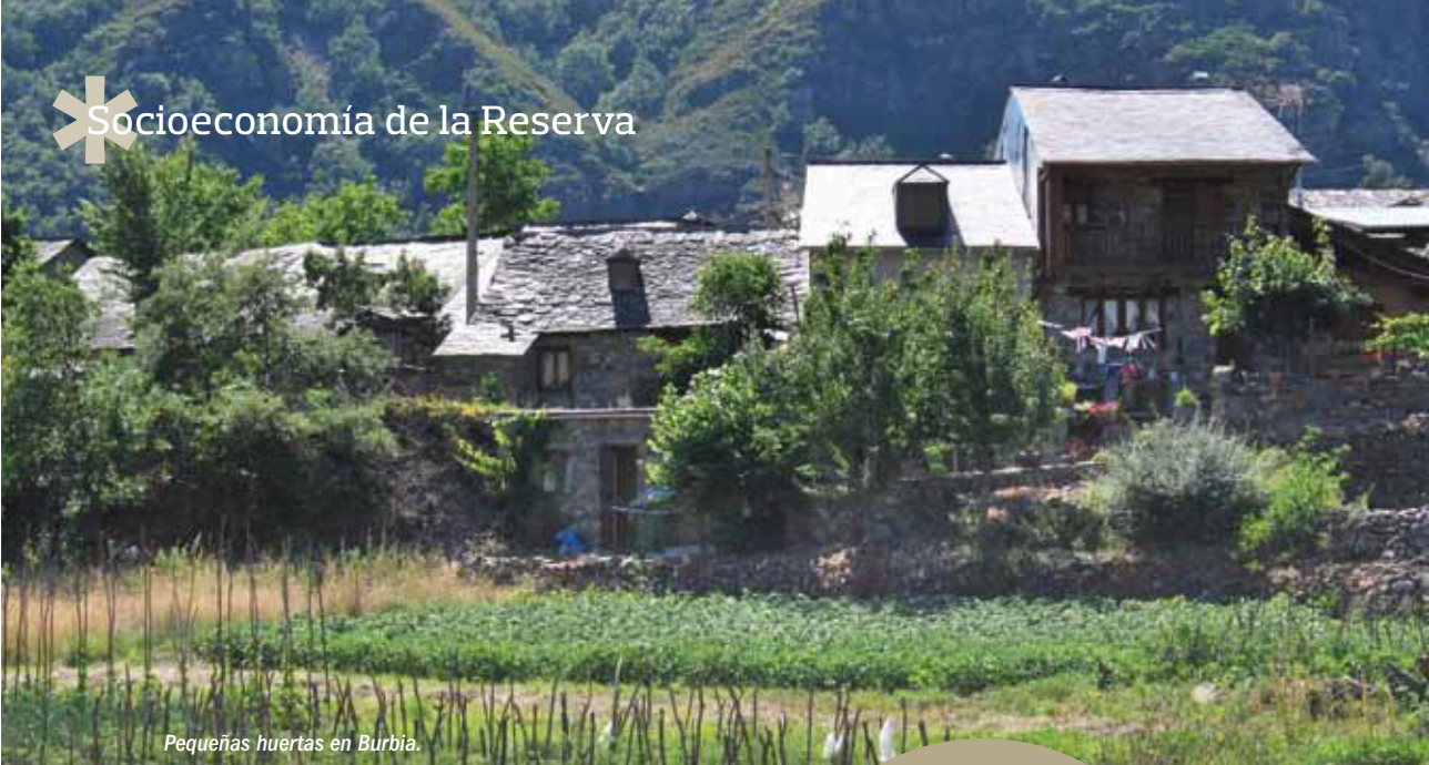
Pequeñas huertas en Burbia.

La principal actividad es la ganadería, basada en el aprovechamiento de los pastos de alta montaña tanto por ovino como por bovino y equino; la agricultura, con gran importancia de la viticultura, y el aprovechamiento cinegético. Recientemente, destaca el aumento del turismo rural. Otra fuente asociada al turismo la representa el Camino de Santiago, que recorre parajes de esta Reserva, con especial mención a Villafranca del Bierzo, localidad que supone inicio y fin de etapa.