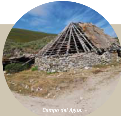
Campo del Agua.

Junto a la paz de estas montañas y valles el viajero puede disfrutar de una