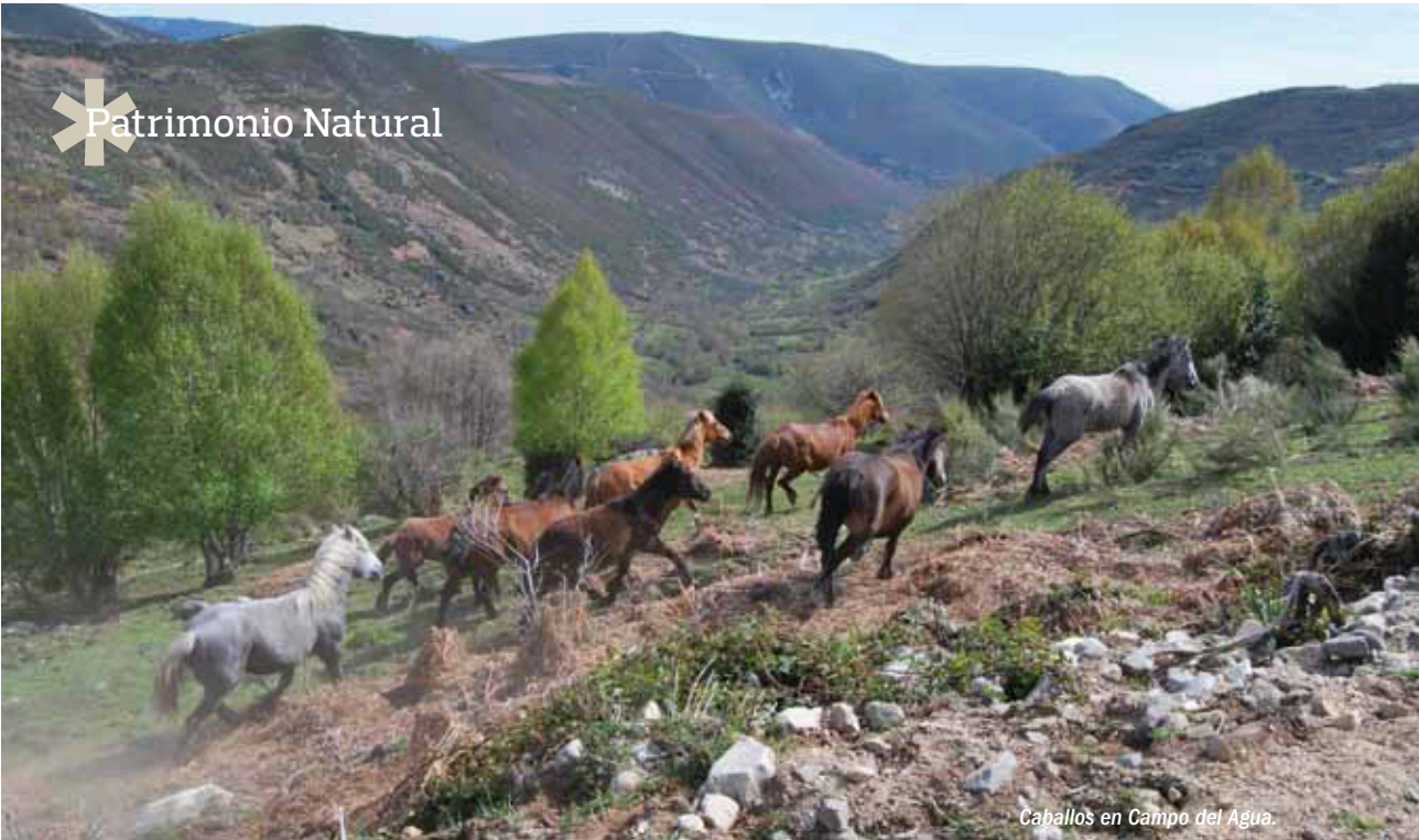
Caballos en Campo del Agua.

Dentro de la Cordillera Cantábrica, la reserva de Los Ancares tiene sus propios elementos diferenciadores que proporcionan identidad a la zona y aportan al conjunto elementos de notable valor y variedad.