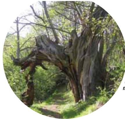
Castaño centenario, monumento natural.

Se encuentran medios agropastorales de gran interés ecológico, puesto que