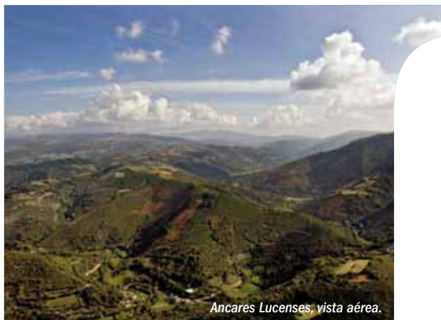
Ancares Lucenses, vista aérea.

Fecha de declaración: 27 de octubre de 2006 Superficie: Extensión oficial: 53.664 ha (núcleo: 26,5%; tampón: 59,6%; transición: 13,9%) Ubicación: Provincia de Lugo (Comunidad Autónoma de Galicia) Municipios: Navia, Cervantes y Becerreá Entidad gestora: INLUDES-Diputación Provincial de Lugo Dirección: Ronda da Muralla 140, 27004 LUGO Teléfono: 982227812 Correo electrónico: laura.vazquez@deputacionlugo.org Web: www.deputacionlugo.org Otras figuras de protección: Zona de Especial Protección de los Valores Naturales (ZEPVN): (2) Lugar de Importancia Comunitaria (LIC) Zona de Especial Protección para las Aves (ZEPA) Zona de Especial Protección para el Oso pardo Reserva Nacional de Caza Región Biogeográfica: Eurosiberiana/Mediterránea