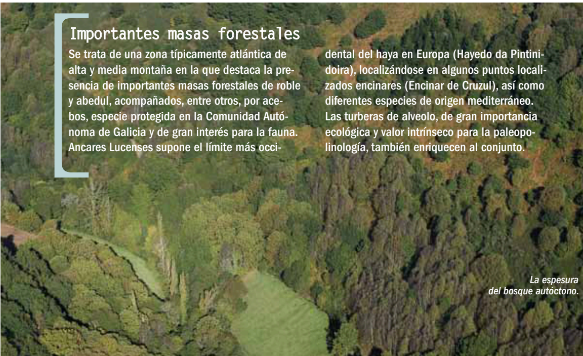
La espesura del bosque autóctono.

dental del haya en Europa (Hayedo da Pintinoeira), localizándose en algunos puntos localizados encinares (Encinar de Cruzul), así como diferentes especies de origen mediterráneo. Las turberas de alveolo, de gran importancia ecológica y valor intrínseco para la paleo-polinología, también enriquecen al conjunto.