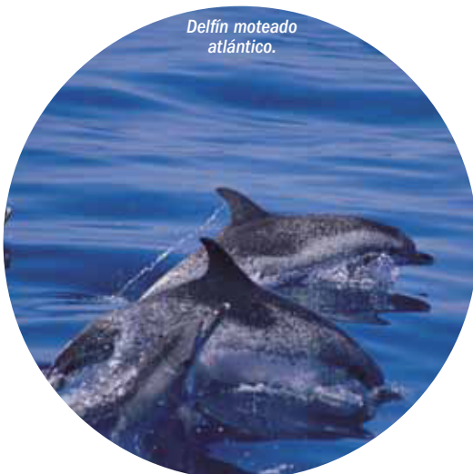
Delfín moteado atlántico.

La Reserva contiene una alta tasa de endemismos motivada por el aislamiento geográfico y peculiaridades del clima. De los 721 taxones que forman su flora vascular, 42 son especies endémicas canarias y 15 son endémicas exclusivas. Se han descrito al menos una especie de hongo, 7 de líquenes y 5 briófitos endémicos.