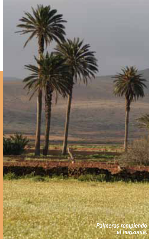
Palmeras rompiendo el horizonte.

Como apoyo a la investigación, el Cabildo ha dispuesto la Estación Biológica