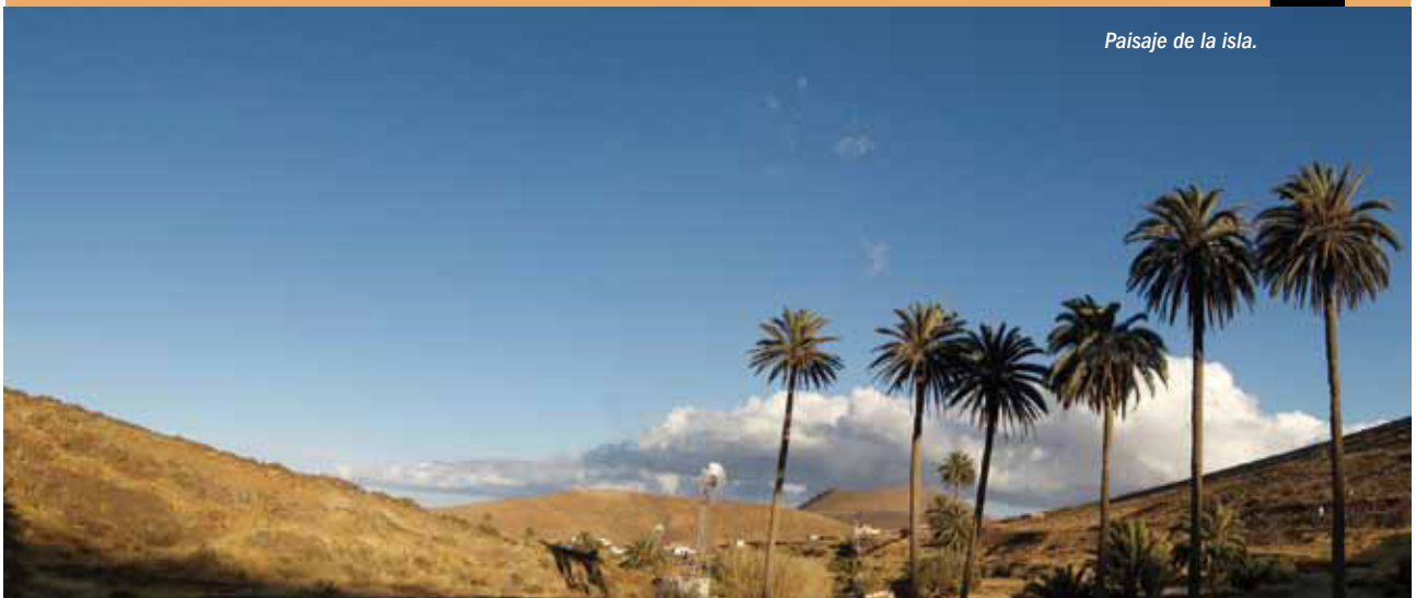
Paisaje de la isla.

gavias, nateros y cadenas, sistemas que combinan el aprovechamiento de la tierra y del agua, son sistemas idóneos para practicar una agricultura de conservación del suelo, una forma secular y sostenible de aprovechamiento de la naturaleza. Junto a estas manifestaciones, existe un rico patrimonio construido, donde destacan los molinos y molinas, los aprovechamientos ganaderos -gambuesas o resguardos-, junto a otros elementos como los hornos de cal o las salinas costeras. Podemos visitar 80 Bienes de Interés Cultural y 13 museos dedicados a una variedad de temas (la sal, la vulcanología, la agricultura, la pesca, la arqueología y la etnografía).