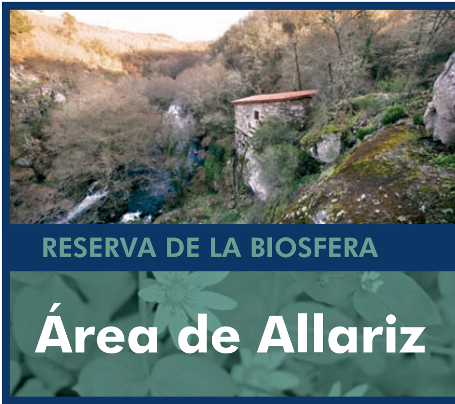
Realización: Colectivo de Educación Ambiental S.L. Impreso en papel 100% reciclado postconsumo libre de cloro. 2009.