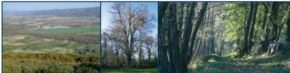
Paisaje de veiga