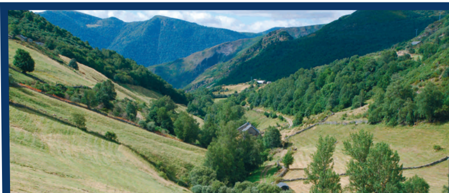
Realización: Colectivo de Educación Ambiental S.L. Impreso en papel 100% reciclado postconsumo libre de cloro, 2010.