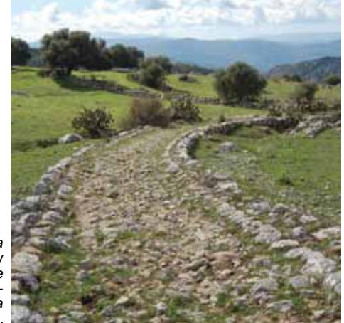
La Calzada Romana entre Benaocaz y Ubrique constituye uno de los senderos de esta Reserva de la Biosfera.

En las cumbres de la sierra es posible encontrar pozos de nieve, utilizados antiguamente para conservar y almacenar la nieve que caía durante el invierno. También son frecuentes las caleras, en cuyo interior se cocía roca caliza durante varios días, para obtener cal, con la que posteriormente encalaban las fachadas de las distintas edificaciones, dando lugar al rasgo constructivo más llamativo de los llamados “pueblos blancos”.