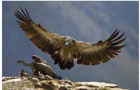
En la Reserva de la Biosfera de Grazalema se encuentra una de las principales colonias de Buitre leonado de Andalucía.