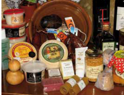
Productos artesanos de la Reserva de la Biosfera de Grazaalema.

La Reserva de la Biosfera de Grazaalema se caracteriza por un predominio del ámbito rural y una gran vinculación de la población a los recursos naturales. El principal generador de empleo es la industria manufacturera (marroquinería y agroindustria como queserías, cárnicas, etc.). Este sector ha sufrido una evolución acorde con los tiempos y se posiciona en la actualidad como bien desarrollado y competitivo. En el sector servicios predominan el comercio y hostelería, que se han incrementado sustancialmente con el progresivo desarrollo del turismo. Es, sin duda, el sector que más ha evolucionado desde la declaración de este espacio como Reserva de la Biosfera. Así, entre 1991 y 2007 las plazas de alojamiento se