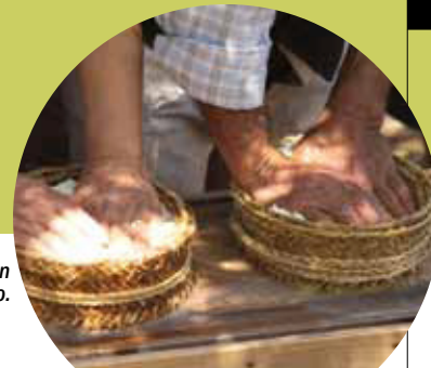
Elaboración artesanal de queso.

ganaderas-, y fija en el mismo territorio el valor añadido de la actividad industrial. Se trata de una actividad muy competitiva, y esta Reserva podría considerarse uno de los territorios donde se fabrican algunos de los mejores quesos españoles de cabra y oveja, con importantes premios a nivel nacional e internacional.