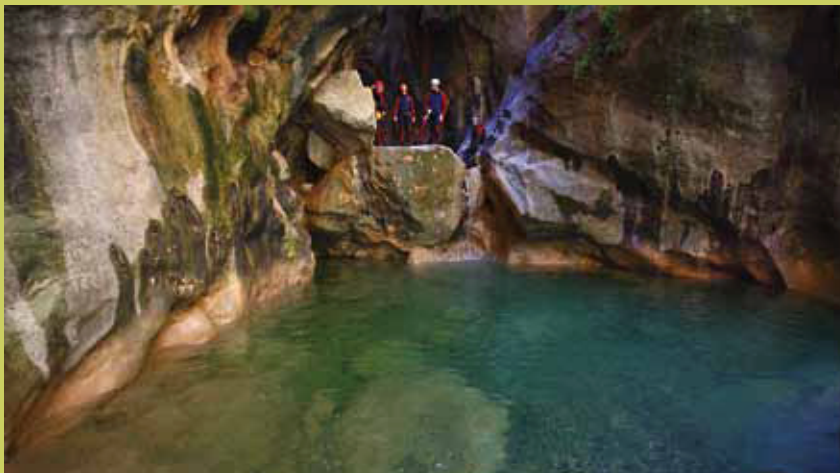
Descenso de cañones en Garganta Verde.

Y como nuevos tiempos traen nuevos retos: al riesgo de sobreexplotación y contaminación de acuíferos, la ordenación del urbanismo o el desarrollo de un turismo responsable, se unen la lucha contra el cambio global o la adaptación de gobernanzas hacia una gestión adaptativa.