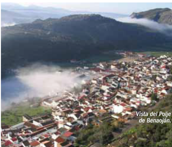
Vista del Polje de Benaoján.

La ganadería se aprovecha mayoritariamente en extensivo y representa una de las actividades más importantes, tanto por su explotación como tal, como por su transformación en productos cárnicos y derivados lácteos, lo que ha mejorado la rentabilidad de estas explotaciones.