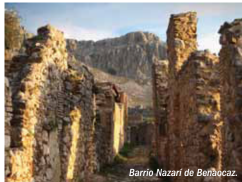
Barrio Nazarí de Benaocaz.

Las infraestructuras vinculadas con la conducción y el aprovechamiento hidráulico, como las minas de agua, acequias, albercas, molinos harineros, martinetes, batanes, centrales hidroeléctricas, etc, constituyen la máxima expresión de una ingeniería tradicional de gran valor cultural.