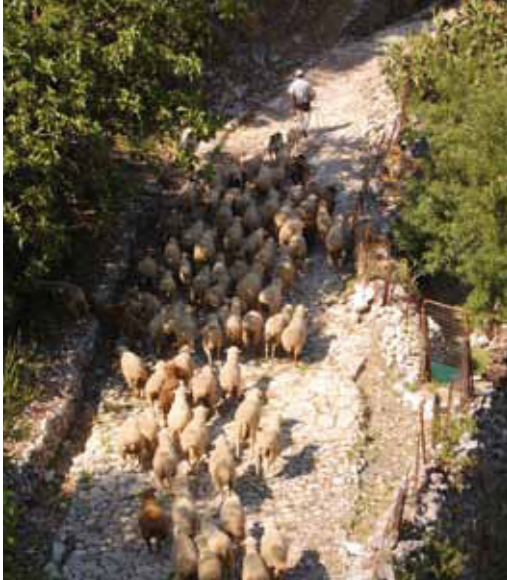
Rebaño de Ovejas Merinas Grazalemeñas por calzada medieval en Grazaalema.