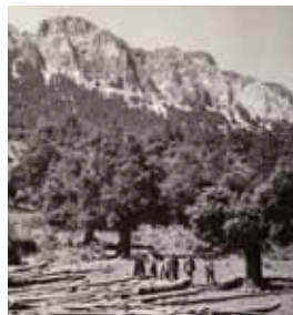
Corta de pinsapos en 1958 para serrería.

La presencia de importantes y frágiles procesos geomorfológicos ligados al karst terminan de perfilar la importancia de los valores naturales de esta Reserva.