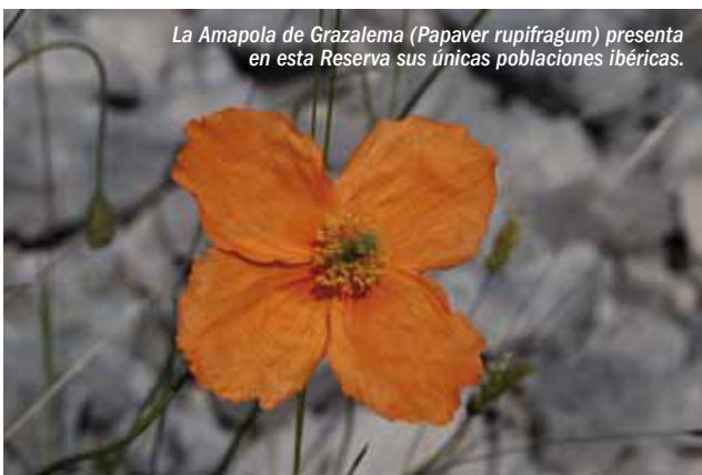
La Amapola de Grazalema ( Papaver rupifragum ) presenta en esta Reserva sus únicas poblaciones ibéricas.

La riqueza florística es muy elevada: Cuenta con más de 1.400 taxones, de los cuales 6 están catalogados En Peligro de Extinción, 15 como Vulnerables y 3 de Interés Especial. Es destacable la presencia de cuatro endemismos locales: Fumana lacidulemiensis , Echinopartium algibicum , Phlomis x margaritae y Narcissus x libarensis .