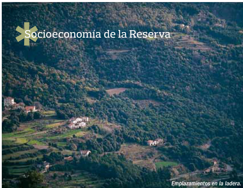
Evolución de la población dentro de la Reserva de la Biosfera del Montseny