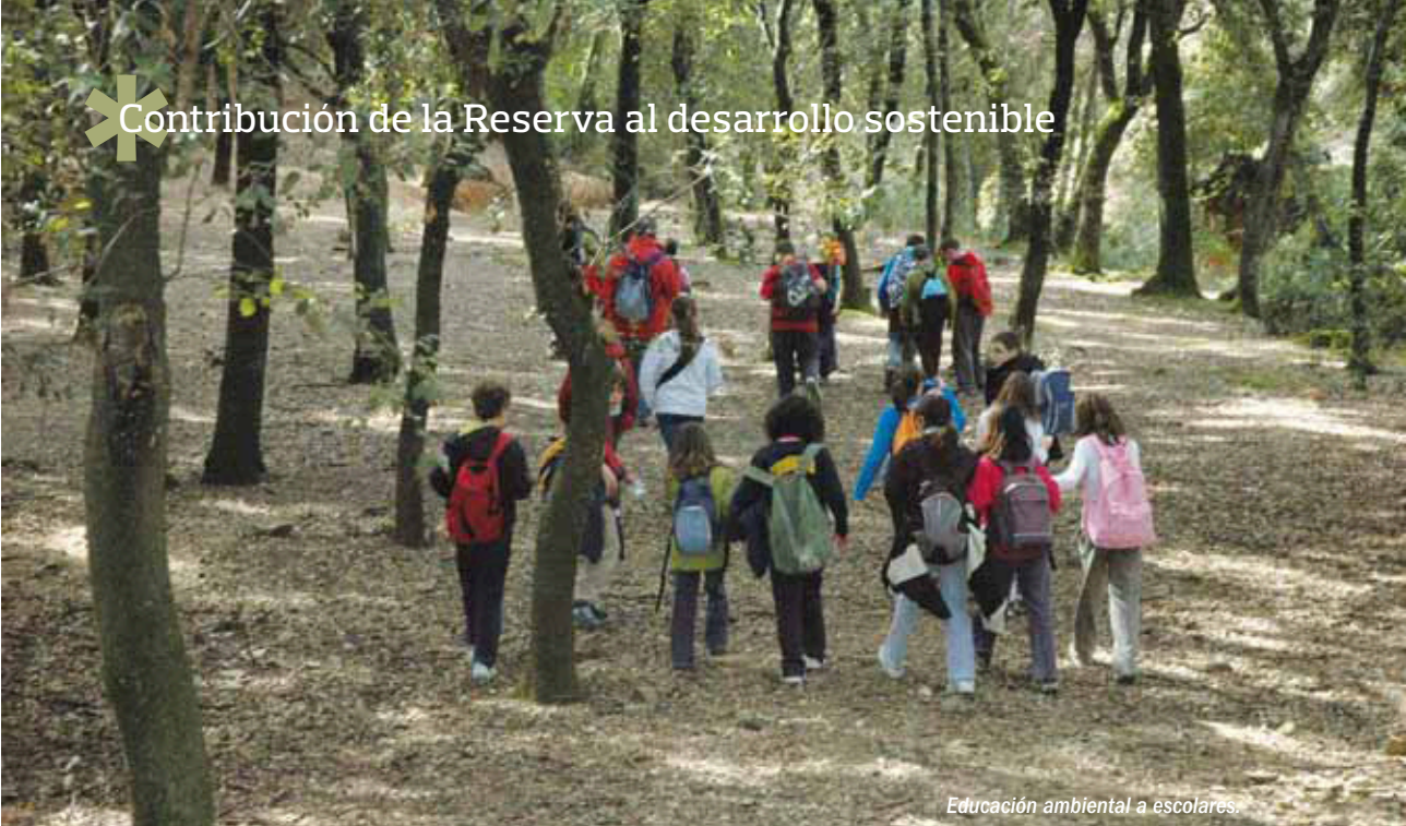
Educación ambiental a escolares.

El Montseny es un espacio dinámico, donde se desarrollan actividades productivas diversas. No sólo el plan especial sino, sobre todo, la gestión, han incorporado, a través del programa de fomento del desarrollo, diversas líneas de actuación destinadas a fomentar las actividades económicas compatibles con el régimen de protección.