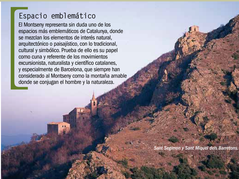
Sant Segimon y Sant Miquel dels Barretons.

El Montseny representa sin duda uno de los espacios más emblemáticos de Catalunya, donde se mezclan los elementos de interés natural, arquitectónico o paisajístico, con lo tradicional, cultural y simbólico. Prueba de ello es su papel como cuna y referente de los movimientos excursionista, naturalista y científico catalanes, y especialmente de Barcelona, que siempre han considerado al Montseny como la montaña amable donde se conjugan el hombre y la naturaleza.