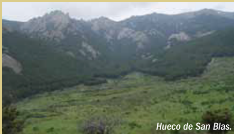
Hueco de San Blas.