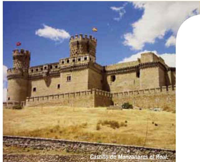
Castillo de Manzanares el Real.

La Reserva contiene un mosaico de sistemas ecológicos representativos de la región biogeográfica a la que pertenece, así como diversos ecosistemas transformados por la acción antrópica a lo largo de siglos, que proporcionan una heterogeneidad de paisajes con alto valor estético y de gran riqueza ecológica. También presenta áreas de interés natural y científico, por la presencia de manifestaciones vegetales, faunísticas, geomorfológicas y paisajísticas objeto de