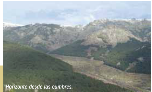
Horizonte desde las cumbres.

En el último siglo, la población local se ha desvinculado progresivamente del medio natural donde se asienta, lo que ha influido negativamente en la conservación del folklore propio de la zona. No obstante, todos los pueblos englobados en el ámbito de la Reserva mantienen manifestaciones populares, como las fiestas patronales y romerías, que les unen a sus raíces.