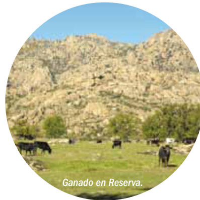
Ganado en Reserva.

En cuanto a las actividades socioeconómicas que se desarrollan en la Reserva y su evolución, hay que destacar el descenso que ha experimentado el sector agropecuario en las últimas décadas. Históricamente, la ganadería extensiva ha sido uno de los pilares de la economía de las poblaciones que conforman la Reserva, especialmente en el ámbito serrano, ligada al uso de dehesas de fresno y de encina. Esta actividad ha ido disminuyendo progresivamente, aunque quedan buenos ejemplos para conservar. El cambio en los usos se ha dirigido hacia el crecimiento del sector terciario, que predomina en la economía