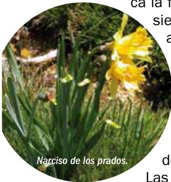
Narciso de los prados.

La geología presenta dos unidades bien diferenciadas, cuyo límite lo marca la falla de Torrelodones: la sierra, donde dominan los afloramientos de rocas silíceas, y la rampa sedimentaria.