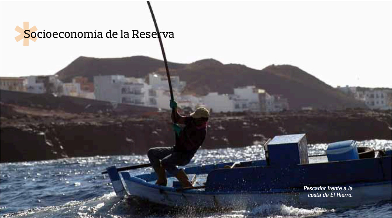
Pescador frente a la costa de El Hierro.

La isla tiene una población de 10.892 habitantes. A lo largo de la historia ha sufrido importantes variaciones, destacando el descenso demográfico acaecido entre las décadas de los 40 y 70 del siglo pasado, debido a las penurias económicas y a las prolongadas sequías. Esta tendencia se ha revertido en los últimos años, en buena medida gracias