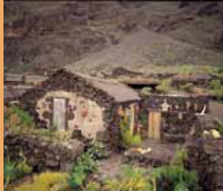
Ecomuseo de Guinea.

Hay numerosos vestigios de los primitivos pobladores de la isla, los Bimbaches o Bimbapes. Grabados rupestres, concheros, cuevas y restos de cabañas constituyen un libro abierto para conocer la vida de estos herreños prehistóricos.