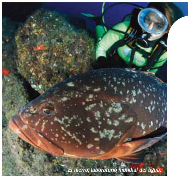
El hierro, laboratorio mundial del agua.

Cabe señalar la situación en la isla del punto más meridional de España, la Punta de La Restinga, y el más occidental, la Punta de Orchilla (antiguo Meridiano Cero).