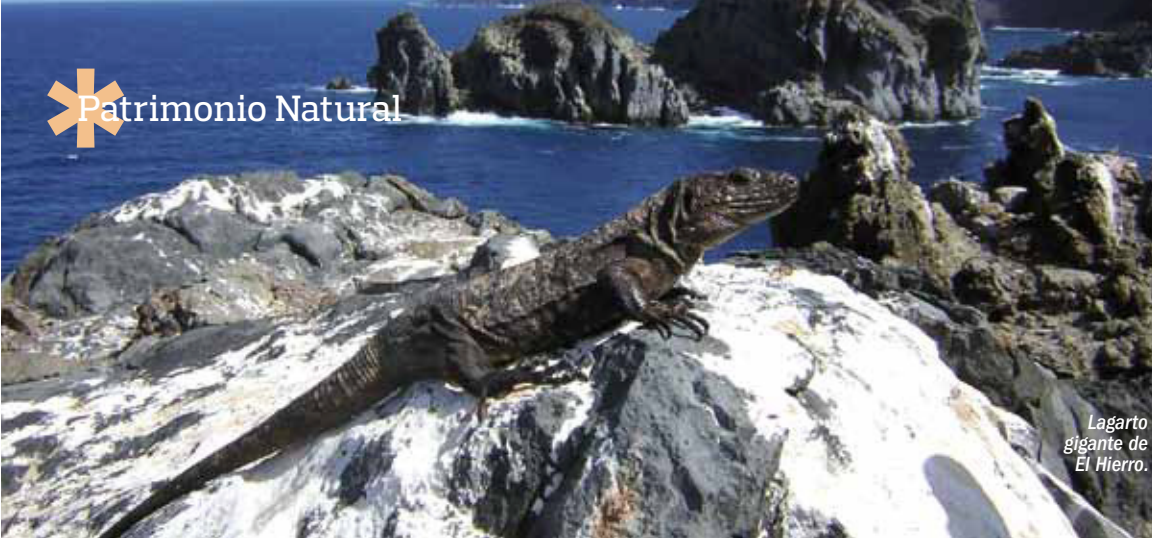
Lagarto gigante de El Hierro.

Geológicamente, la isla es de origen volcánico, al igual que el resto del archipiélago canario. Así, en el paisaje destacan las coladas de lava, cráteres y vegetación asociada a ese tipo de sustrato.