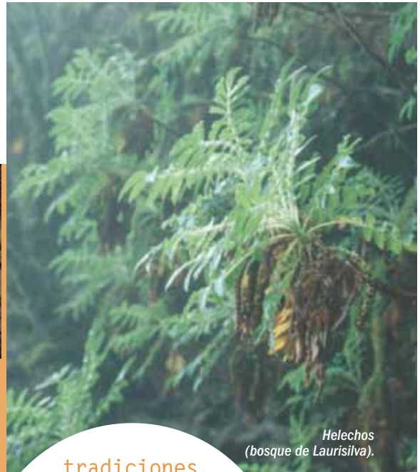
Helechos (bosque de Laurisilva).