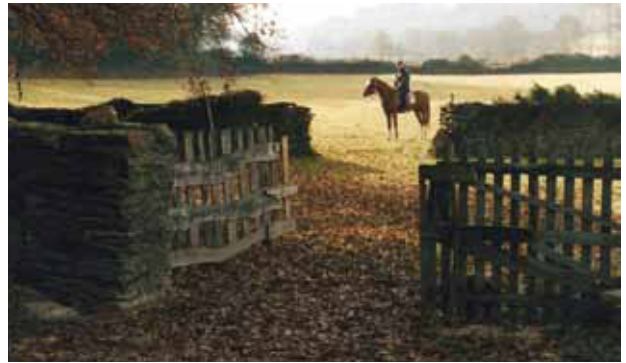
La Reserva de la Biosfera Terras do Miño, reflejo de la integración hombre-naturaleza.

El Turismo Termal tiene su presencia en el Balneario de Lugo, que aloja también unas termas romanas, y en el Balneario de Guitiriz,