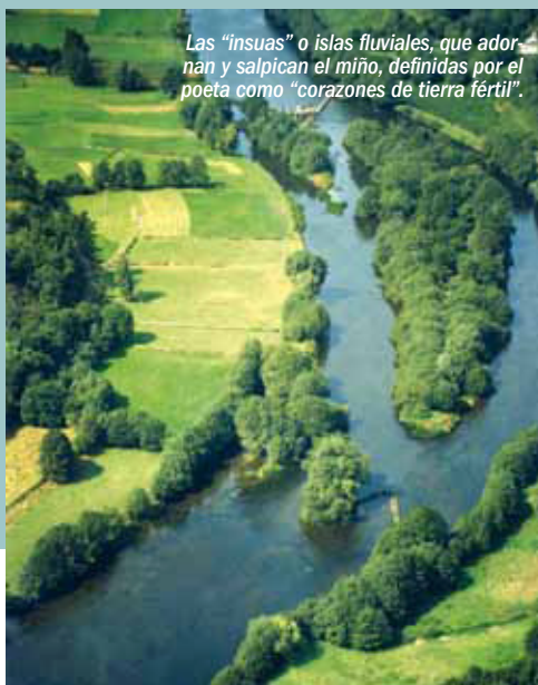
Las "insuas" o islas fluviales, que adornan y salpican el miño, definidas por el poeta como "corazones de tierra fértil".

Existe un importante número de especies de invertebrados acuáticos, destacando mejillón o madreperla de río ( Margaritifera margaritifera ), muy amenazado. Entre las especies piscícolas presentes en los ríos de la reserva, destaca el espinoso, además de otras es-