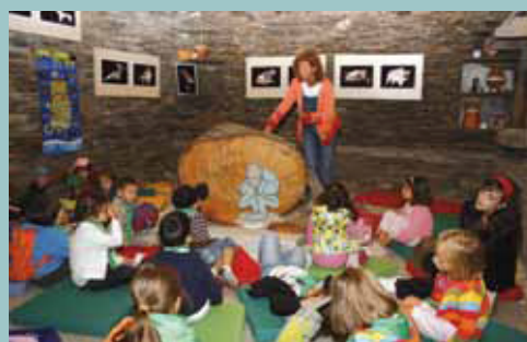
Actividades de educación ambiental. Centro de interpretación Terras do Miño"

En la actualidad, la gestión de la Reserva está apoyada por el proyecto Lugo 02 y por el Programa de visitas Kilómetro 0, que fomentan el desarrollo endógeno de los municipios y el conocimiento interno y valoración del medio natural y cultural por parte de la población local.