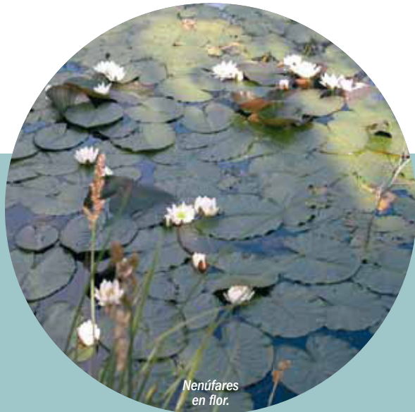
Nenúfares en flor.