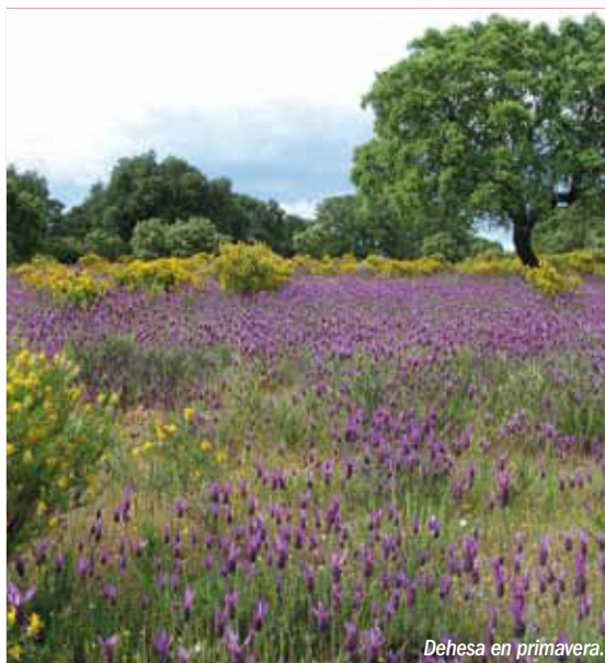
Dehesa en primavera.

Fecha de declaración: 9 de septiembre de 2003