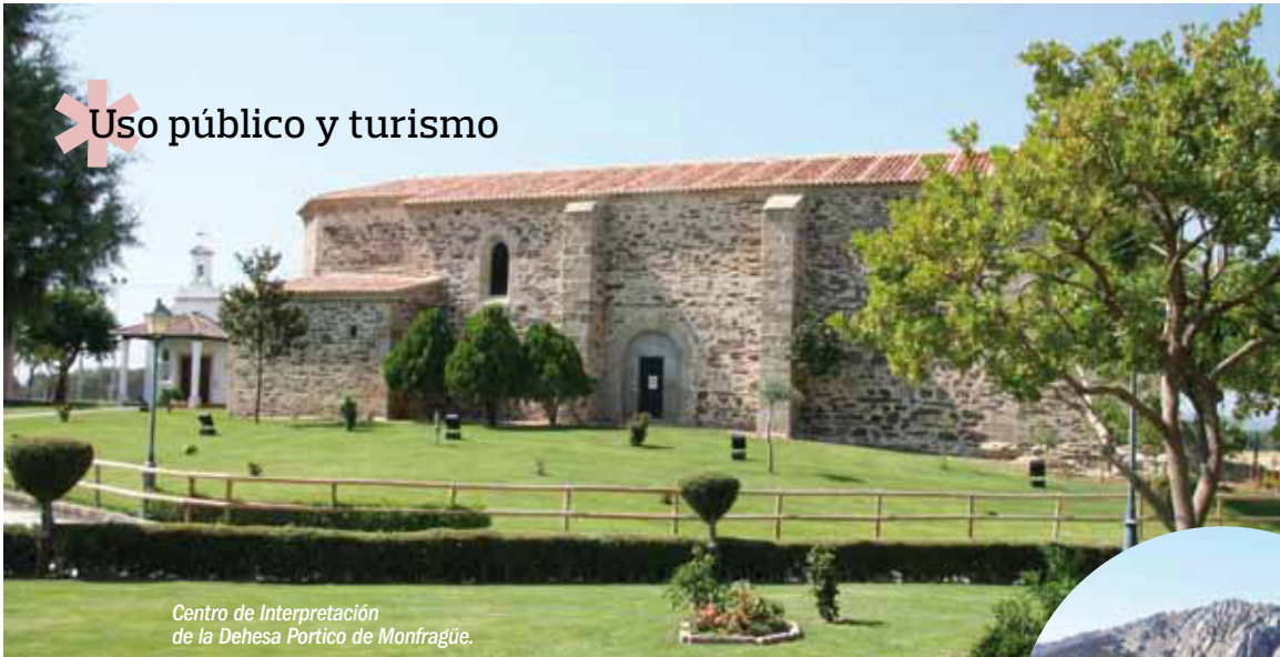
Centro de Interpretación de la Dehesa Portico de Monfragüe.

La Reserva de Monfragüe está surcada por una numerosa red de vías pecuarias que significan la importancia del territorio en la trashumancia. La Cañada Real de la Plata, la Cañada Real Leonesa Occidental y un conjunto de cordeles y veredas que las relaciona, son caminos que posibilitan una red de senderos de gran valor natural y cultural. A este recurso hay que añadir el conjunto de rutas señalizadas en el Área de Uso Público del Parque Nacional.