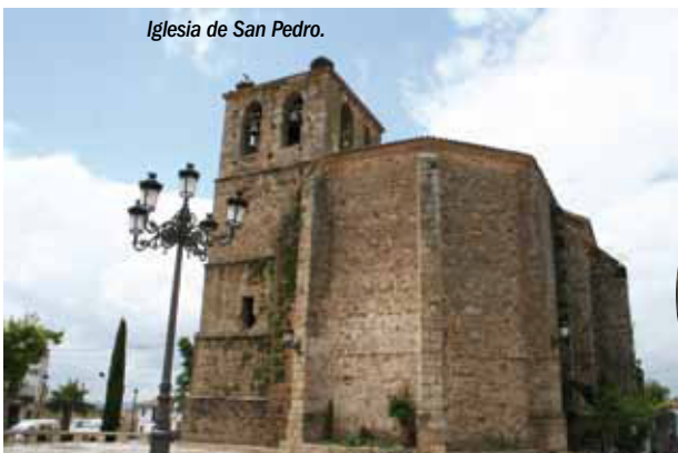
Iglesia de San Pedro.

El paisaje de Monfragüe ha marcado siempre el desarrollo de su historia. La vegetación frondosa cercana a cursos de agua, y los abrigos rocosos en las crestas cuarcíticas de la sierra, acogieron algunas de las primeras poblaciones humanas, que han dejado como testimonio un amplio patrimonio de pinturas rupestres de estilo esquemático datadas entre comienzos del tercer milenio y mediados del primero a.C. (Epipaleolítico, Edad del Cobre y Edad del Bronce). En el corazón del Parque puede visitarse uno de los ejemplos más representativos, un abrigo conocido como la Cueva del Castillo.