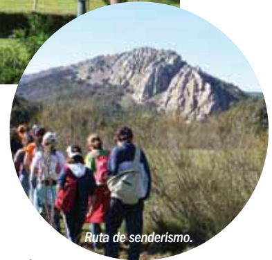
Ruta de senderismo.

sita con información sobre la naturaleza y la historia de Monfragüe.