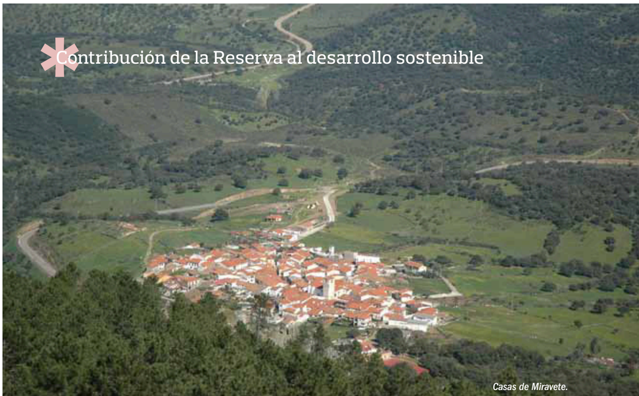
Casas de Miravete.