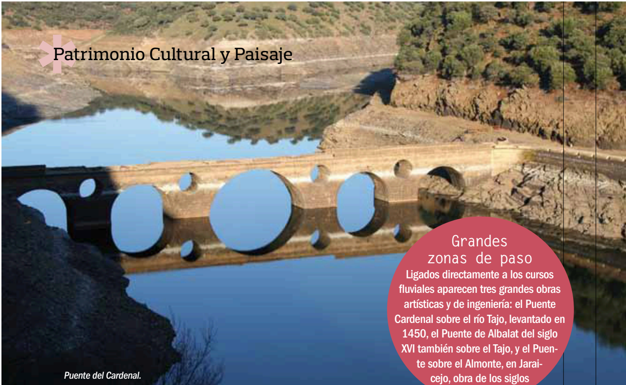
Puente del Cardenal.