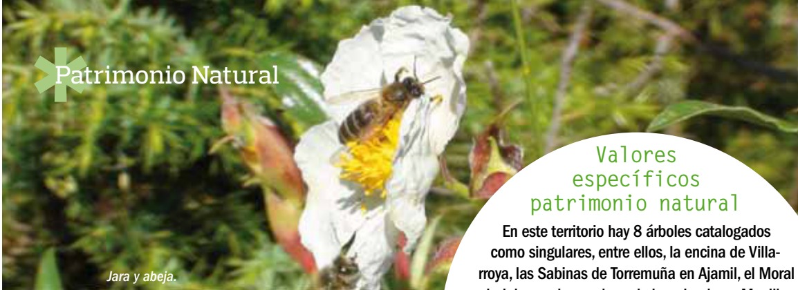
Jara y abeja.