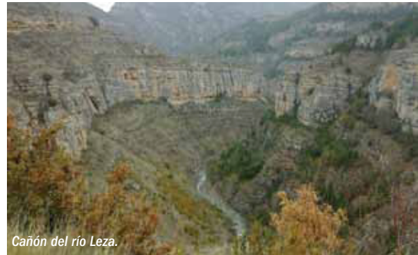
Cañón del río Leza.

La presencia del hombre celtíbero en la Reserva tiene su gran exponente en el poblado de Contrebia Leukade, en Aguilar del río Alhama, con asentamientos desde la Edad del Hierro (s. X a. C.) y celtí-