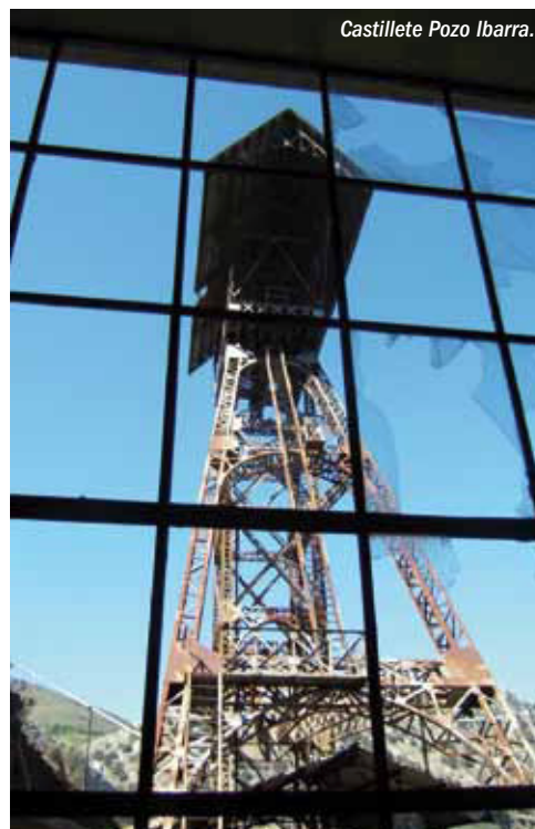
Castillete Pozo Ibarra.

La minería ha sido un recurso económico de gran importancia desde muy antiguo, se pueden citar al menos dos explotaciones prerromanas y varias minas que extraían cobre, níquel, cobalto y villamanita, este último mineral fue descubierto en el municipio de Villamanín. La minería del carbón es hoy el pilar de la economía de la comarca, destacando la declaración del castillete del Pozo Ibarra como Bien de Interés Cultural, el primer elemento perteneciente a la arquitectura industrial minera que recibe este reconocimiento en Castilla y León.