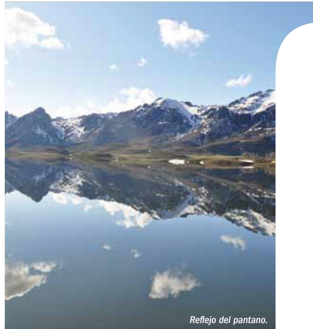
Reflejo del pantano.

Fecha de declaración: 29 de junio de 2005