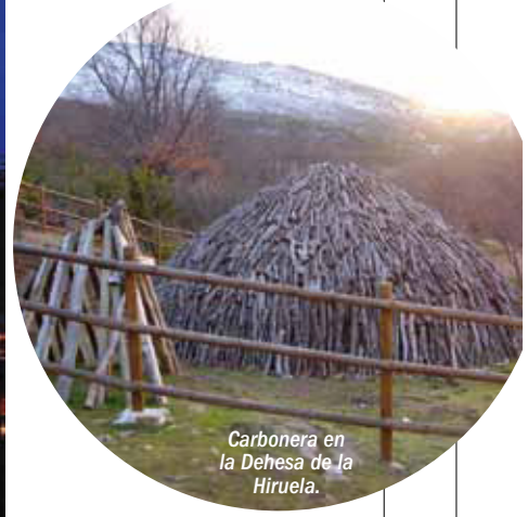
Carbonera en la Dehesa de la Hiruela.

La arquitectura agropecuaria tiene un alto interés, pues muestra señales de un pasado ganadero aún perceptible. Los pueblos de piedra forman el conjunto rural más atractivo de la provincia. La casa serrana, construida con los materiales de la zona, es el reflejo humanizado de la esencia de la sierra. Las