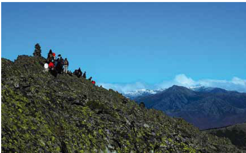
Sendas de educación y sensibilización ambiental. Peña la Cabra.