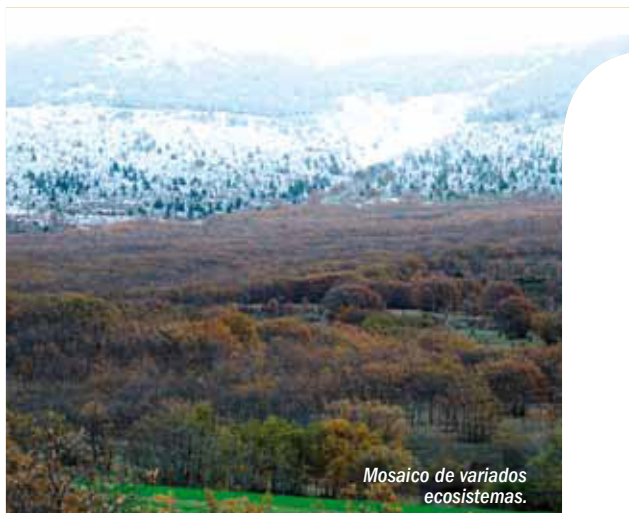
Mosaico de variados ecosistemas.

Caminos de colorido tapiz natural que invitan a pasear.