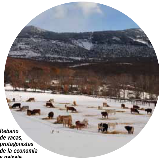
Rebaño de vacas, protagonistas de la economía y paisaje.

La tranquilidad y el silencio que se disfruta en cada uno de los municipios tienen su origen en el escaso número de habitantes y en sus actividades económicas. En el año 2007, La Hiruela no alcanzaba los 100 habitantes, mientras que Montejo, el más poblado, tenía 330 habitantes. Al igual que en el resto de la geografía española, la Sierra del Rincón sufrió en la década de los 60 del siglo pasado un fuerte despoblamiento; sin embargo, la tendencia de los últimos años es hacia una ligera recuperación poblacional.