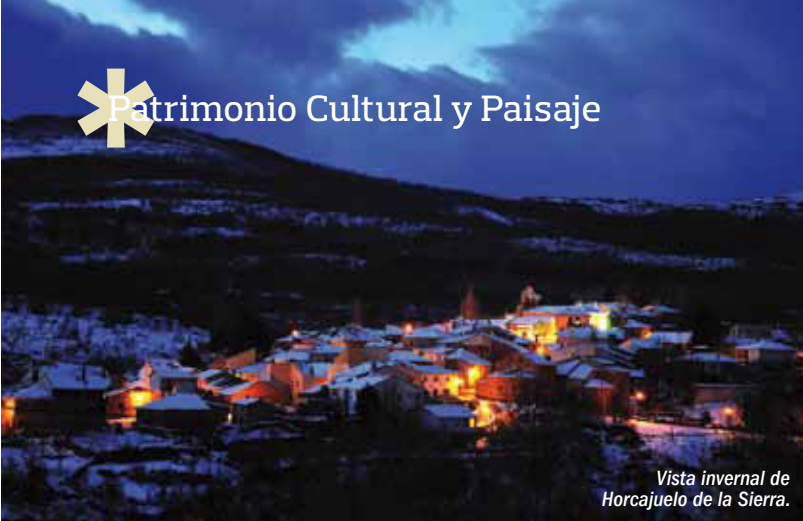
Vista invernal de Horcajuelo de la Sierra.