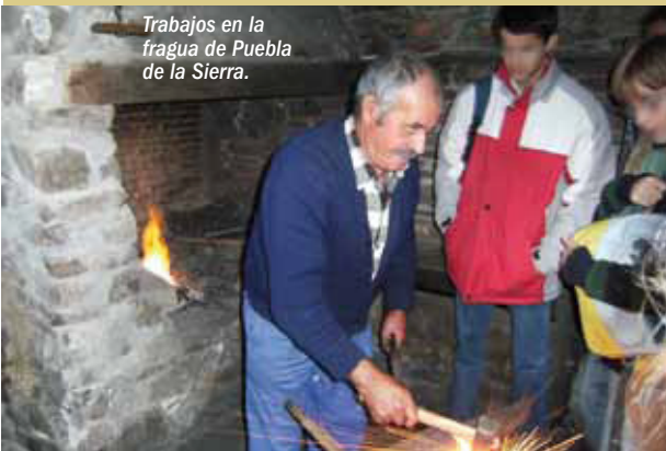
Trabajos en la fragua de Puebla de la Sierra.

Por la amplia red de senderos señalizados, puede admirarse, a lo largo de todas las estaciones del año, la variedad cromática de los matorrales, serbales, arces, temblones, robles, en un entorno natural modelado por la ganadería secular y los huertos serranos, sin alteraciones urbanísticas y sin presión urbana.