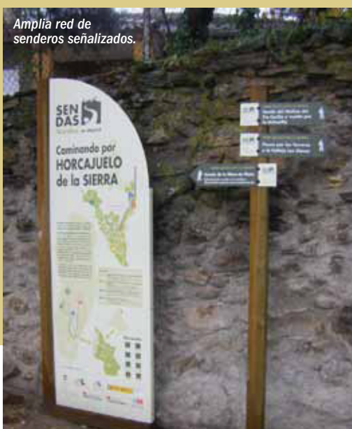
Ampliá red de senderos señalizados.

El gran número de establecimientos de turismo rural garantiza una estancia relajante en sus acogedoras instalaciones, en un ambiente cálido y agradable.