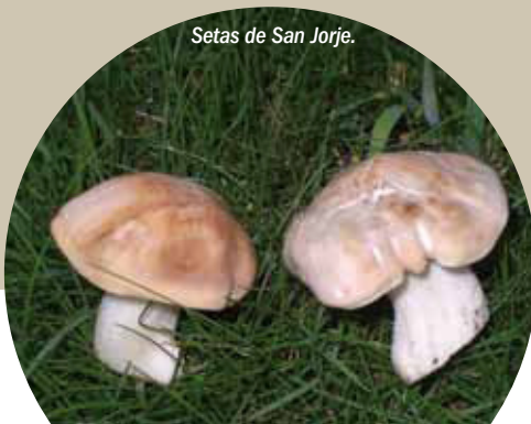
Setas de San Jorge.

Los ríos, el Embalse de Luna y demás zonas húmedas permiten la existencia de poblaciones de aves acuáticas, como anátidas, rállidas o ardeidas; nutrias y, cómo no, la trucha común, uno de los mayores atractivos turísticos.