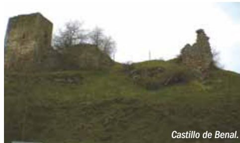
Castillo de Benal.

las vegas de los ríos, y la necesidad de pequeñas huertas de autoconsumo, ofrecen mosaicos únicos de la montaña leonesa. Algunas vistas de singular belleza se encuentran en Barrios de Luna, con el embalse acompañado de grandes calizas tapizadas de sabinas, o Cueto Rosales, donde las vistas de Omaña y sus bosques son espectaculares. Todas invitan a participar de unos paisajes únicos.