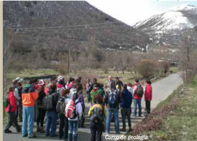
Curso de geología.

2. “Estudio del estado de conservación de las masas boscosas en función de los aprovechamientos tradicionales e implicación de la población en los procesos participativos de la Reserva”, 2010-2011, actualmente en proceso de desarrollo, pretende aportar modelos que permitan la conservación