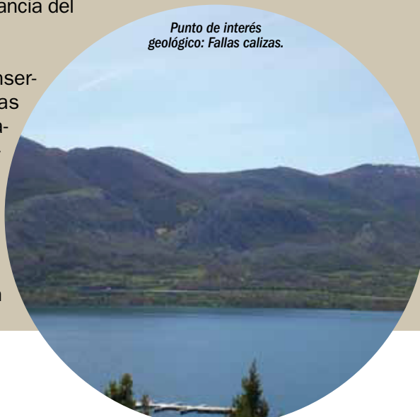
Punto de interés geológico: Fallas calizas.

3. Por otro lado, se están llevando a cabo distintos Convenios entre el Ministerio de Medio Ambiente y Medio Rural y Marino, (2008, 2009, 2010), destacando las numerosas actuaciones que se están desarrollando para la recuperación de patrimonio etnográfico, de recuperación de paisaje, y de puesta en valor del territorio.