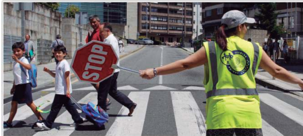
Camiños Escolares