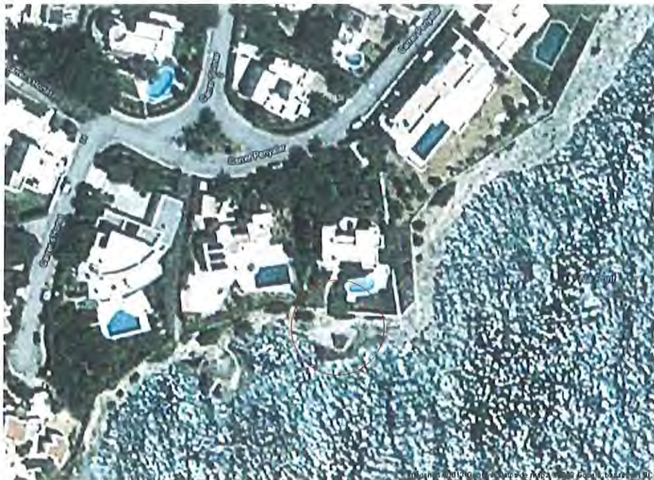
Situación de solicitud de concesión en la Urbanización Cala Serena, T.M. de Felanitx

El terreno en zona de dominio público en la que solicita la concesión tiene acceso por el Pasaje S/N situado entre las parcelas número catastral 0989901 y 1089907, siendo accesible al pasaje por la calle Penyalar, Término Municipal de Felanitx, Mallorca.