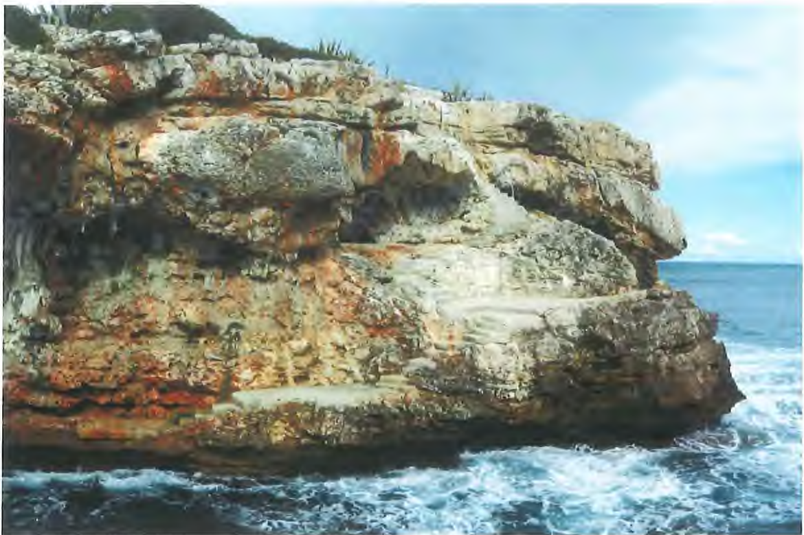
Vista de escalera y solárium en dominio público, la cual se solicita concesión administrativa

encuentran una pequeña solera de forma irregular y dos bancos de aproximadamente 5,30 m 2 , de la cual parte otra escalera de ancho variable de 8 peldaños adaptas todas al terreno natural hasta llegar a un solárium de forma irregular a cota 4,70 m y una superficie aproximada de 21,00 m 2 , siguiendo al mar se encuentra otra escalera de ancho promedio de 90 cm y 11 peldaños llegando está a una solera de forma trapezoidal de 7,40 m 2 sobre cota 2,50 m siguiendo, una escalera de ancho promedio de 80 cm y 4 peldaños llegando a una solera de forma rectangular de 3,60 m 2 sobre cota 1,70 m en la cual se encuentra una escalera de aluminio que facilita la entrada y salida del agua.