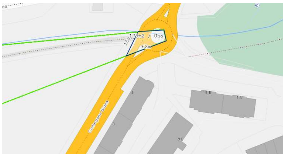
Medición de la superficie de la zona de la concesión.