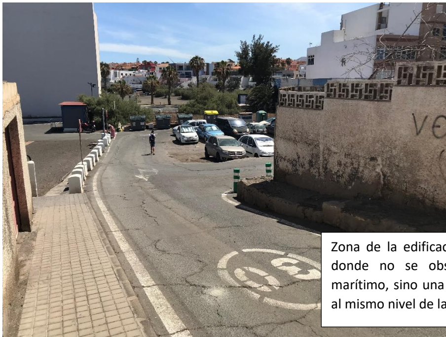
Zona de la edificación del deslinde donde no se observa un paseo marítimo, sino una estructura viaria al mismo nivel de la playa.