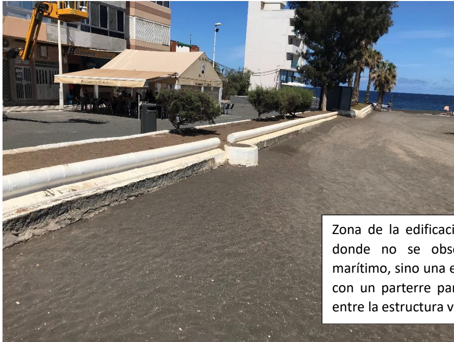
Zona de la edificación del deslinde donde no se observa un paseo marítimo, sino una estructura viaria, con un parterre para la separación entre la estructura viaria y la playa.