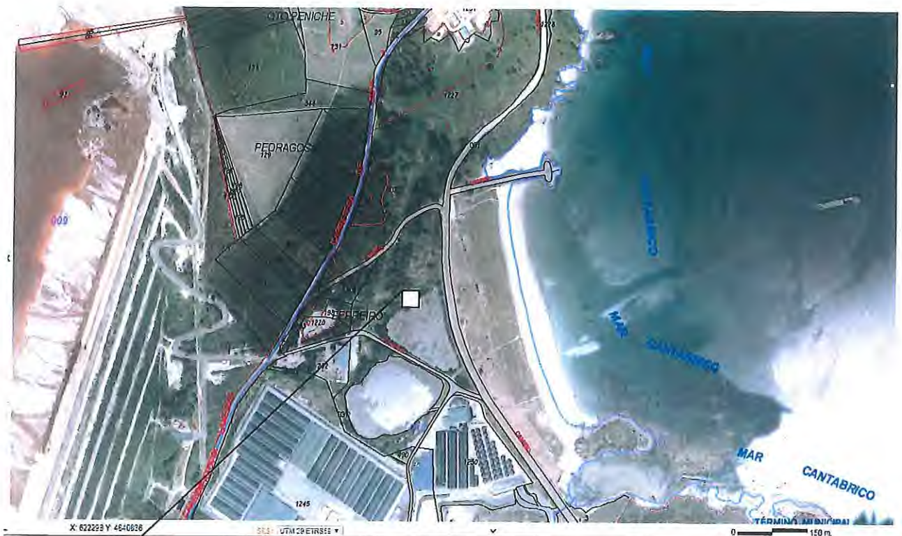
UBICACIÓN OBSERVATORIO ORNITOLOGICO. Playa de Lago.-XOVE.(Lugo).