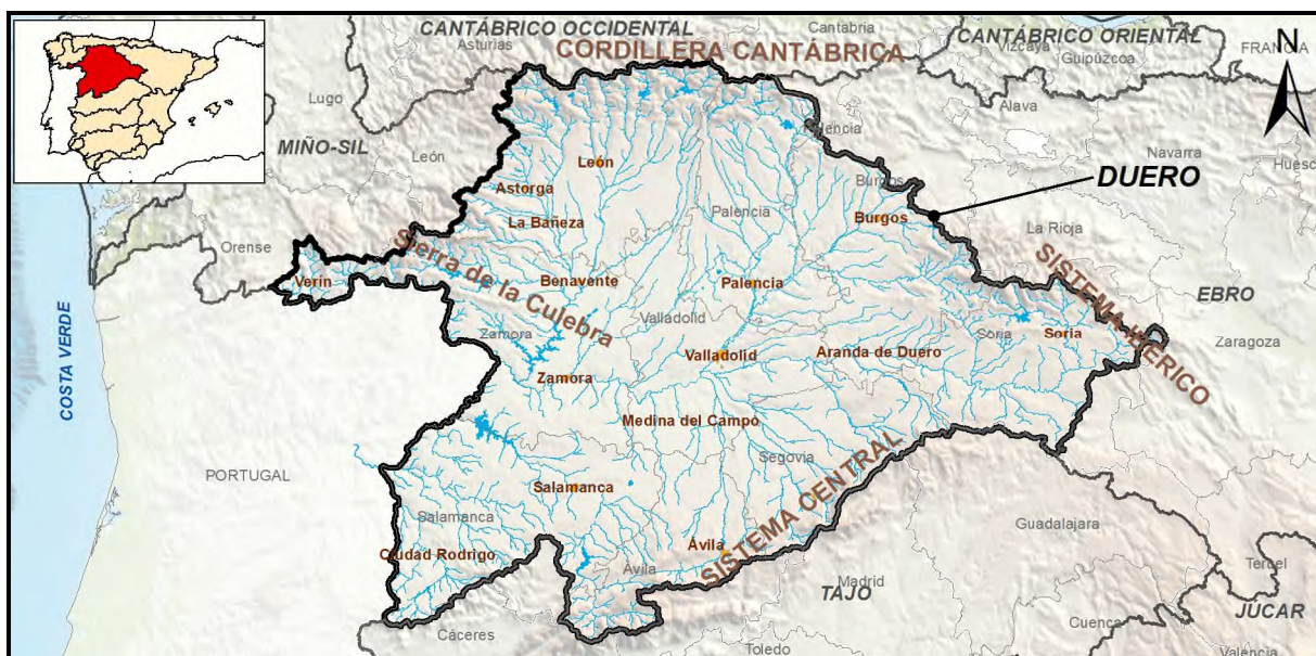
Figura 1. Ámbito geográfico de la parte española de la demarcación hidrográfica del Duero.