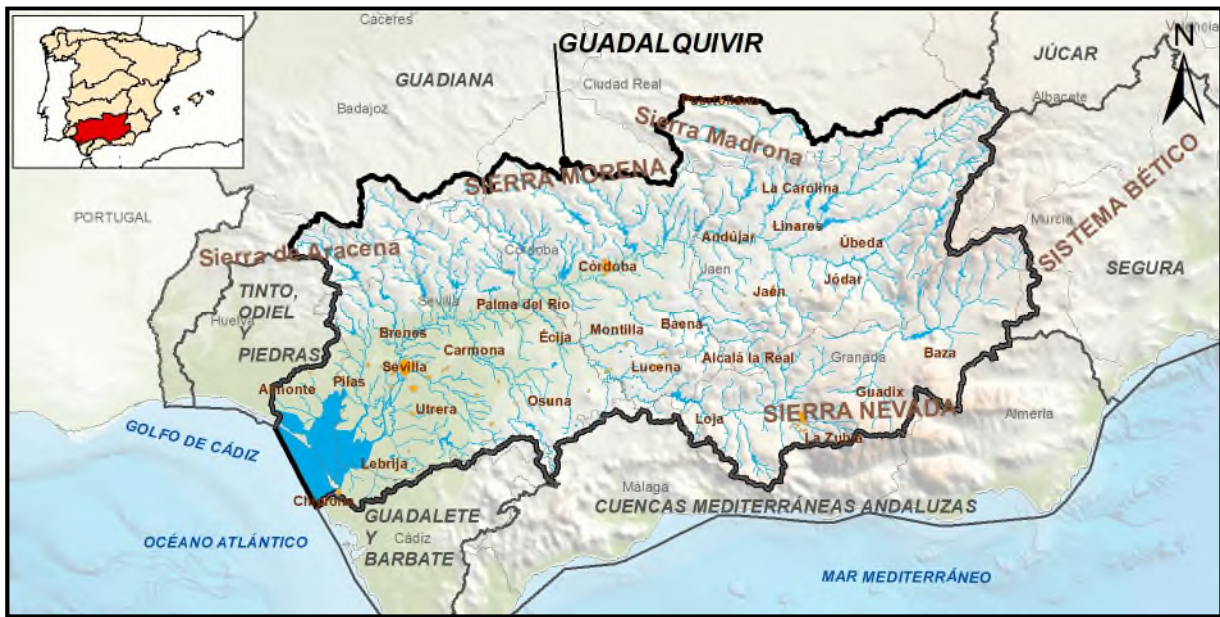
Figura 1. Ámbito geográfico de la demarcación hidrográfica del Guadalquivir.