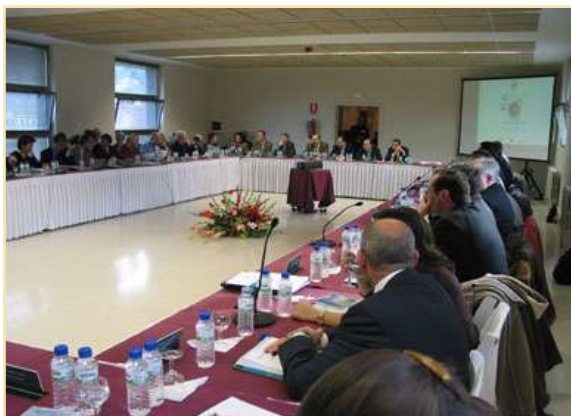
Reunión Plenaria Mieres, 13 de diciembre de 2002