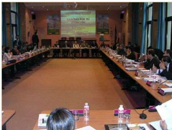
Reunión Plenaria Madrid, 17 de octubre de 2003