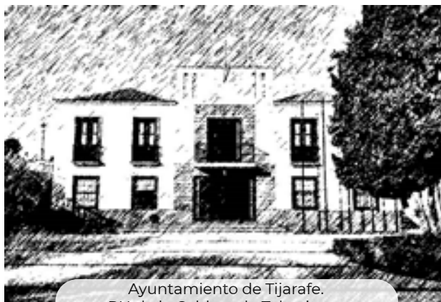
Ayuntamiento de Tijarafe. PN de la Caldera de Taburiente

En el último cuarto de siglo cuatro, de los nueve municipios del AIS aumentaron su población cuatro, llegando Breña Alta a aumentar casi un 30% su población. Los cinco municipios restantes sufrieron pérdidas de población, siendo Santa Cruz de la Palma la que mayor número de habitantes perdió, en números absolutos. Barlovento fue, no obstante, el municipio que perdió mayor porcentaje (28%) de habitantes. Globalmente, los municipios del AIS tienen una densidad de 87,9 personas/km 2 , valor muy inferior a los datos de la provincia o de la comunidad autónoma.