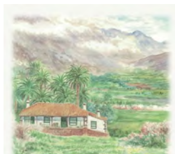
Ilustración: Bernardo Lara

El saldo natural o tasa de crecimiento natural de población 1 (diferencia entre los nacimientos y las defunciones referidas al total de la población) en los municipios del Área de Influencia Socioeconómica del Parque Nacional de la Caldera de Taburiente tiene valores negativos, es decir se producen más fallecimientos que nacimientos. Por otro lado, la tasa de migración, que nos informa de los movimientos de las personas entre municipios, tiene valores positivos lo que significa que se producen llegadas de personas desde otras partes, sobre todo de extranjeros en una proporción de 1:3. En este AIS, por lo tanto, el aumento de habitantes viene marcado por la tasa de migración ya que el saldo natural población es negativo.