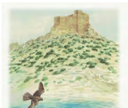
Ilustración: Bernardo Lara

En los municipios de las Áreas de Influencia Socioeconómica del Parque Nacional del Archipiélago de Cabrera el saldo natural o tasa de crecimiento natural de población 1 (diferencia entre los nacimientos y las defunciones referidas al total de la población) tiene un valor de cero, es decir se producen prácticamente el mismo número de nacimientos que de fallecimientos. Por otro lado, la tasa de migración, que nos informa de los movimientos de las personas entre municipios, tiene valor casi de cero lo que significa que existe un equilibrio entre las salidas y las llegadas de personas desde otras partes.