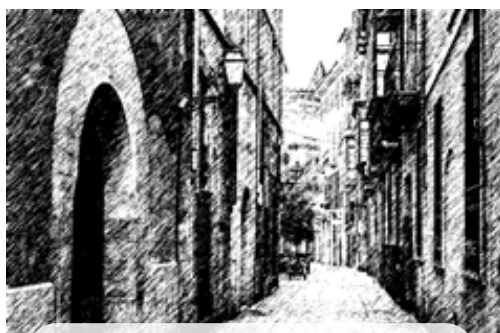
Palma. PN de Cabrera

El 46,5% de la superficie del Área de Influencia Socioeconómica del Parque Nacional Marítimo-Terrestre del Archipiélago de Cabrera la ocupan zonas agrícolas, principalmente dedicadas a terrenos regados permanentemente, a mosaicos de cultivos de pequeñas parcelas de cultivos anuales (pastos, barbechos y/o cultivos permanentes con casas o huertos dispersos) y a frutales. Ocupando un 28% de la superficie se encuentran las zonas artificiales, compuesto principalmente por tejidos urbanos discontinuos, por tejido urbano continuo y por zonas industriales y comerciales. Prácticamente el 25% del territorio del AIS restante está ocupado por zonas forestales, principalmente por vegetación esclerófila arbustiva (maquis y garriga, agrupaciones de palmito o formaciones arbóreas de euforbios en áreas termo-mediterráneas) y con menores extensiones encontramos bosques de coníferas.