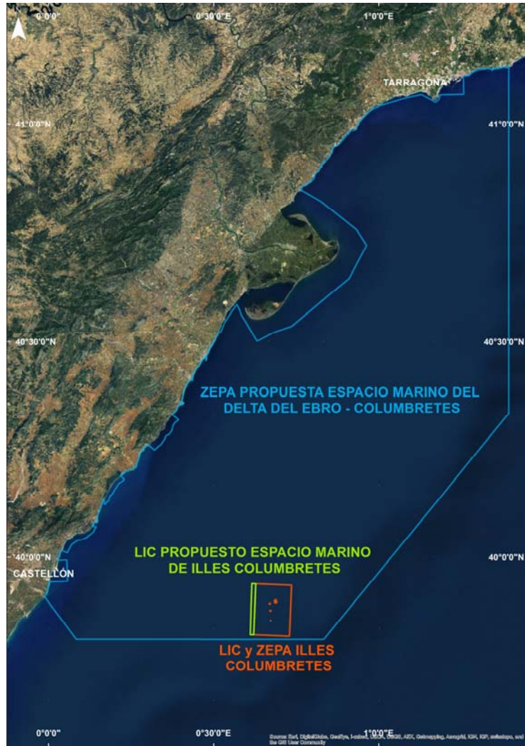
Figura 1 ZEPA del Espacio Marino de Delta del Ebro-Columbretes y LIC ES000061 Illes Columbretes