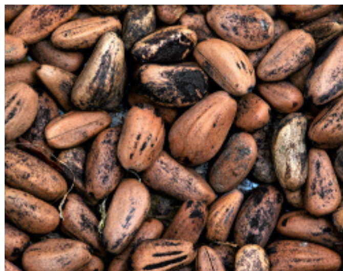
Emilio Laguna Lumbreras

Su semilla, el piñón, es considerado un fruto seco de alta calidad; se puede comer crudo, tostado o cocido [2,3,5-10,13-15,18,19,22,24,26-29]. En Cardenete, Enguñadanos (Cuenca) y muchos lugares, los piñones son buscados por los niños, que los consumen como golosina [2,10].