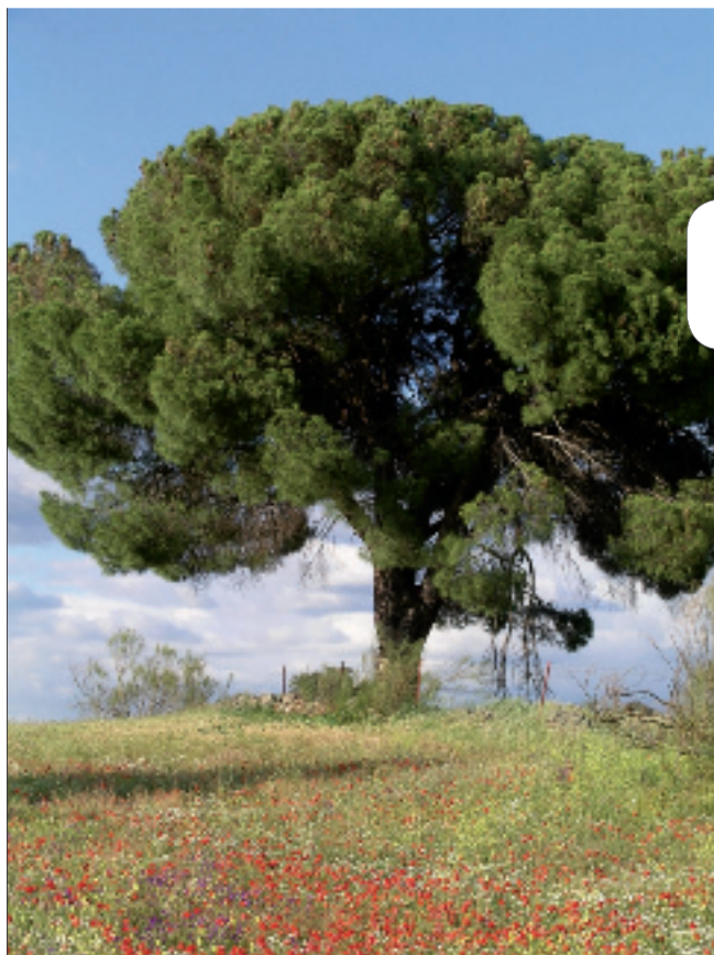
Emilio Laguna Lumbreras