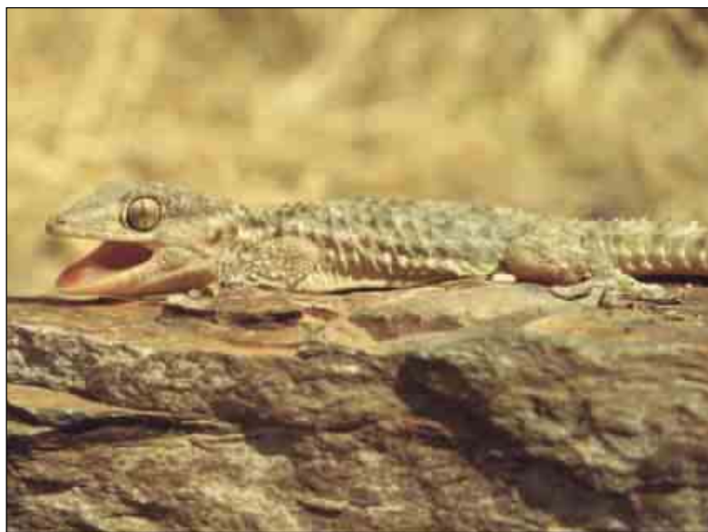
Ejemplar de Coimbra, Portugal.

No es una especie amenazada. Antes al contrario, su capacidad para convivir con el hombre le permite mantener poblaciones saludables con pocos enemigos naturales y refugios seguros. Aunque a veces el ser humano la mata al encontrarla en casa y los animales domésticos la capturan ocasionalmente, estas pérdidas pare-