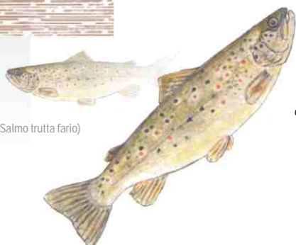
Trucha común (Salmo trutta fario)

El nombre de Boca de Asno proviene de la angostura que las rocas forman. Como a otros lugares de la zona no le falta su propia leyenda.