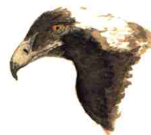
Águila imperial (Aquila adalberti)

Acabaremos nuestro paseo en Boca del Asno, una de las áreas recreativas de los Montes de Valsaín.