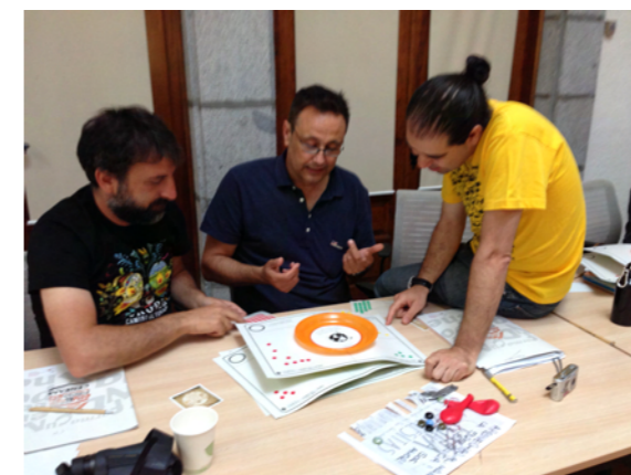
Taller "Huella de carbono. Nuestros peores (¿y mejores?) registros IX Jornadas de Intercambio de Experiencias Hogares Verdes Valsain, 8, 9 y 10 de junio de 2015