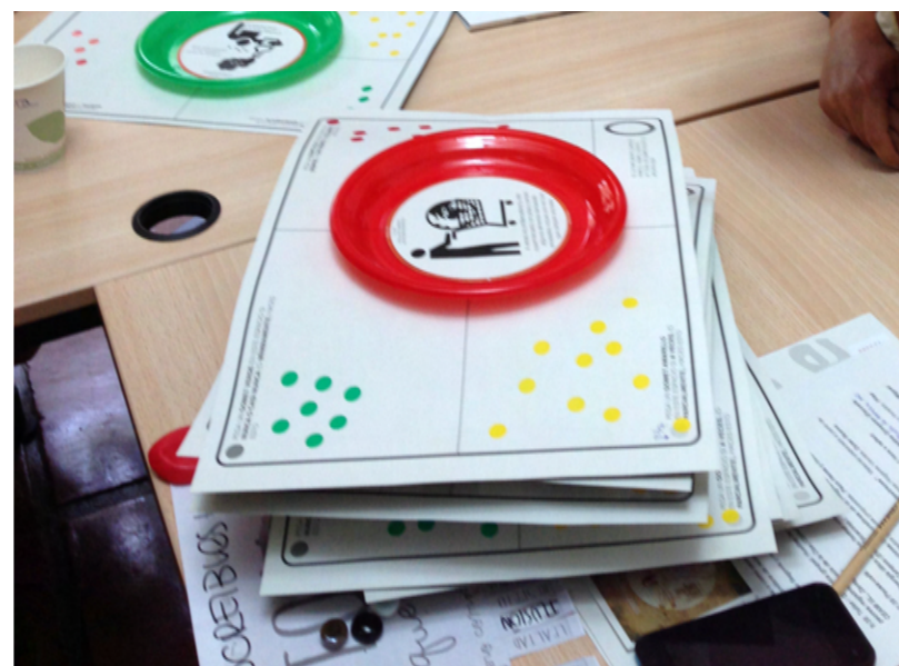
Taller "Huella de carbono. Nuestros peores (¿y mejores?) registros IX Jornadas de Intercambio de Experiencias Hogares Verdes Valsain, 8, 9 y 10 de junio de 2015