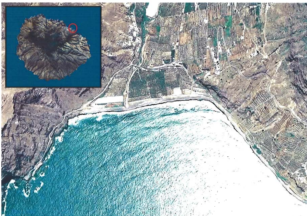
Figura 5. Playa de Hermigua (Isla de La Gomera).