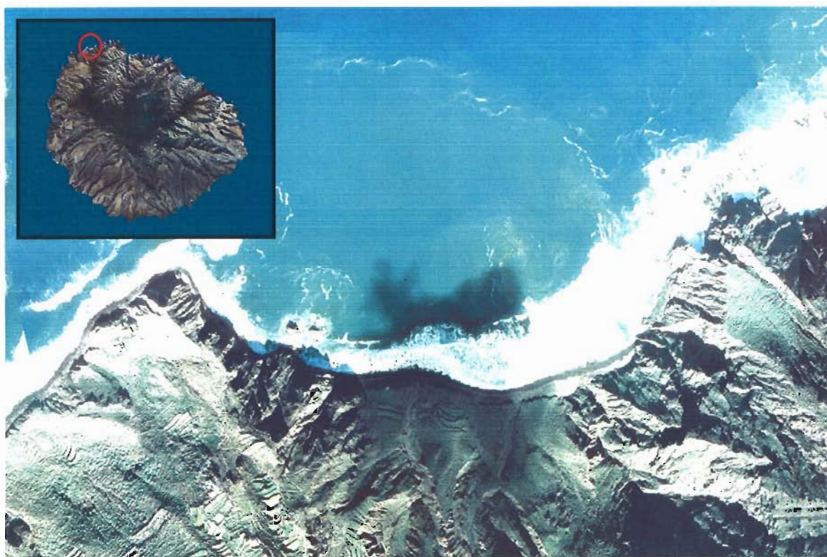
Figura 143. Playa de Arguamul (Isla de La Gomera).