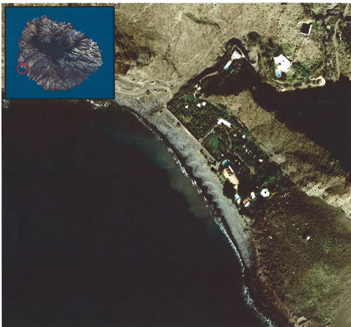
Figura 121. Playa de Argaga (Isla de La Gomera).