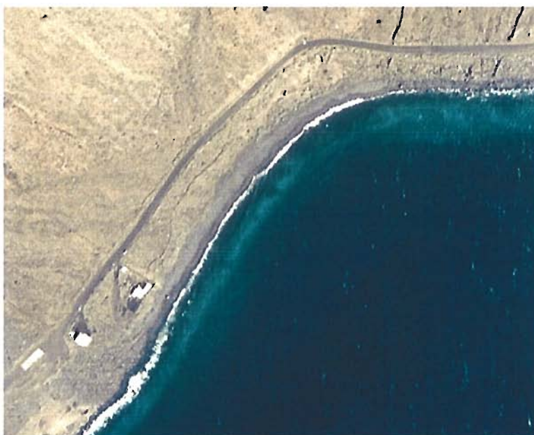
Figura 126. Año 1989