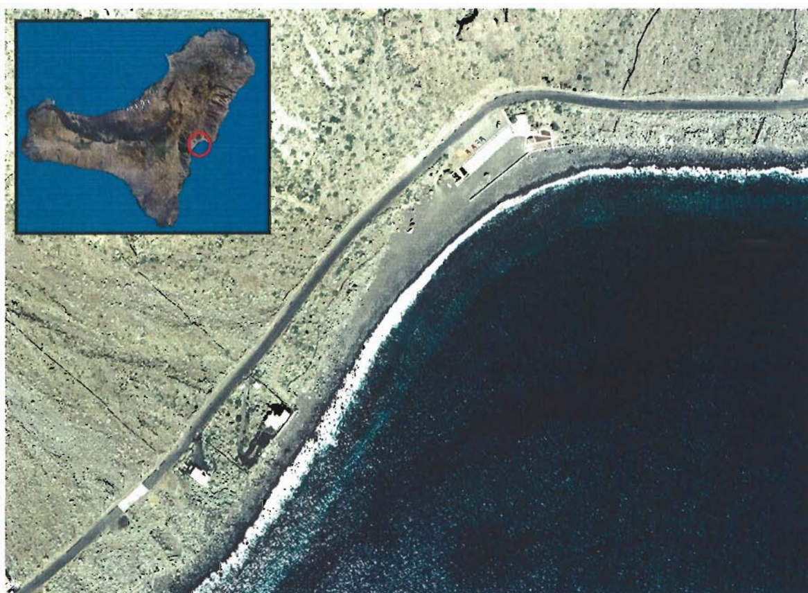
Figura 124. Las Playas (Isla de El Hierro).