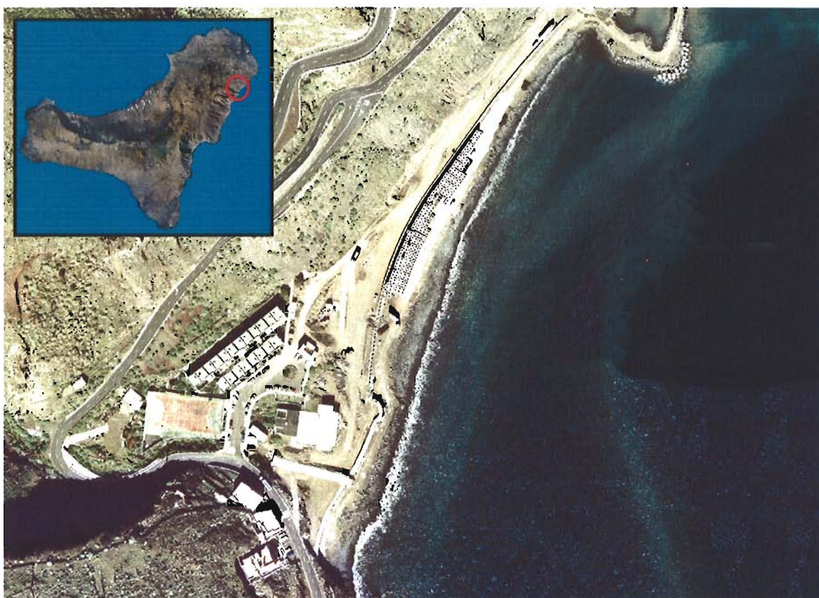
Figura 109. Playa del Puerto de La Estaca (Isla de El Hierro).