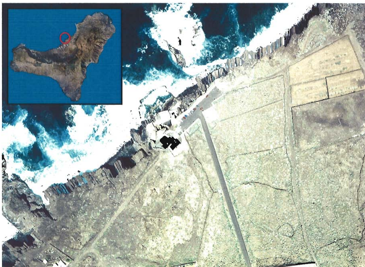
Figura 67. Playa de La Maceta (Isla de El Hierro).