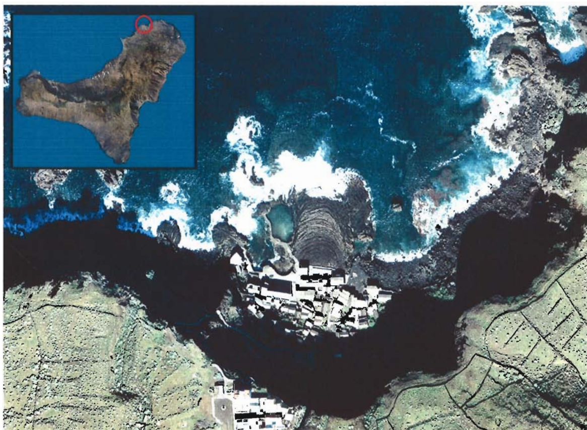
Figura 79. Playa de El Pozo de Las Calcosas (Isla de El Hierro).