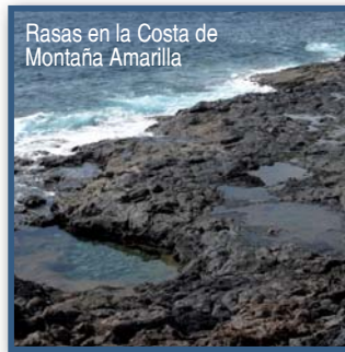
Rasas en la Costa de Montaña Amarilla