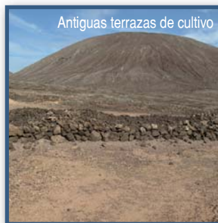
Antiguas terrazas de cultivo