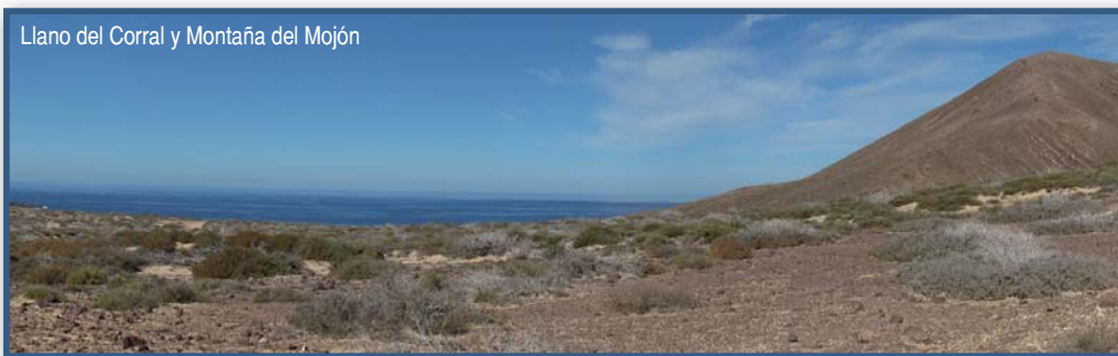
Llano del Corral y Montaña del Mojó

En la Baja del Corral, las corrientes marinas dominantes y el relieve submarino, forman olas muy valoradas para la práctica del surf. Desde esta zona parte el camino de regreso a Caleta del