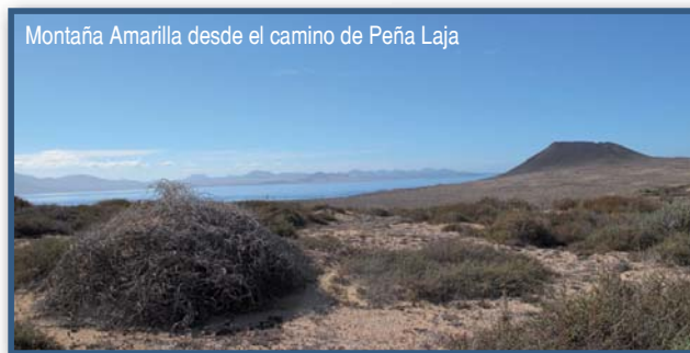
Montaña Amarilla desde el camino de Peña Laja

Sebo que atraviesa el Llano del Corral en dirección sureste, con los Riscos de Famara al fondo. A este camino, por el que no pueden circular bicicletas, se incorporan algunas sendas en desuso que no se deben tomar para facilitar su regeneración natural. A lo largo de este tramo se tienen unas panorámicas únicas del campo dunar estabilizado por la vegetación entre la Montaña Amarilla y El Mojó que avanzan lentamente hacia el suroeste. El camino asciende suavemente en dirección suroeste hacia Peña Laja en suaves eses, regalando unas magníficas vistas sobre el Llano del Corral, Montaña Amarilla y Montaña del Mojó. Dejando la loma de Peña Laja a nuestra derecha, el camino baja hacia Caleta del Sebo con los impresionantes Riscos de Famara al fondo.