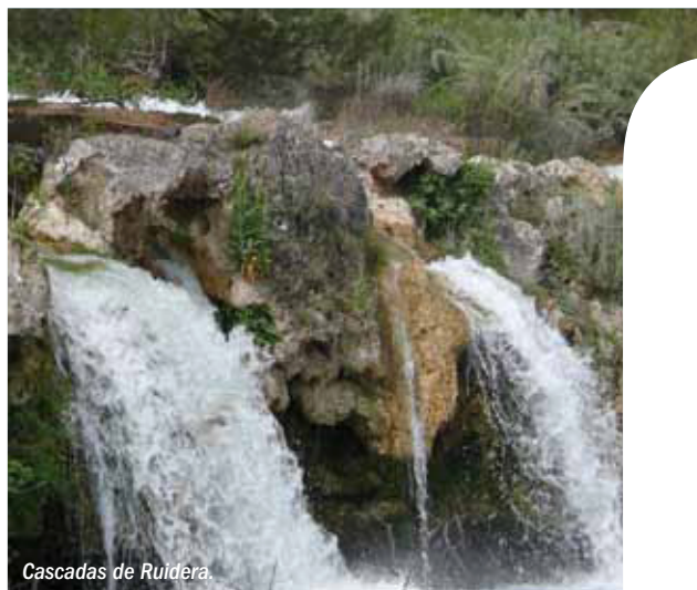
Cascadas de Ruidera.

Actualmente, se está trabajando en una ampliación que superaría las 400.000 ha.