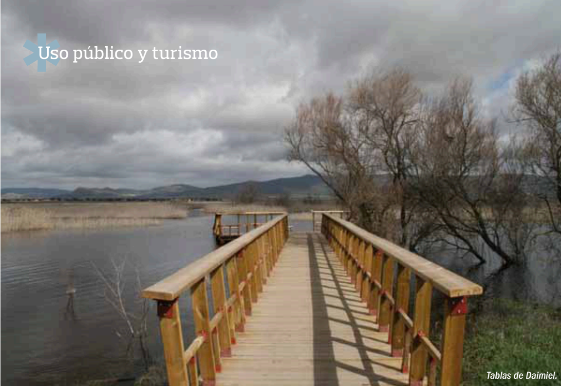
Tablas de Daimiel.

En el extenso territorio de la Mancha Húmeda se encuentran diferentes equipamientos dirigidos a un turismo especializado en observación de la naturaleza. En Daimiel, el Parque Nacional dispone de un Centro de Visitantes con información muy detallada de Las Tablas de Daimiel e itinerarios preparados para todo tipo de visitantes. Además, cuenta con el Centro de Interpretación del Agua en el municipio. Por su parte, Ruidera dispone de otro Centro de Interpretación para Visitantes, en el que se desarrollan programas de educación ambiental