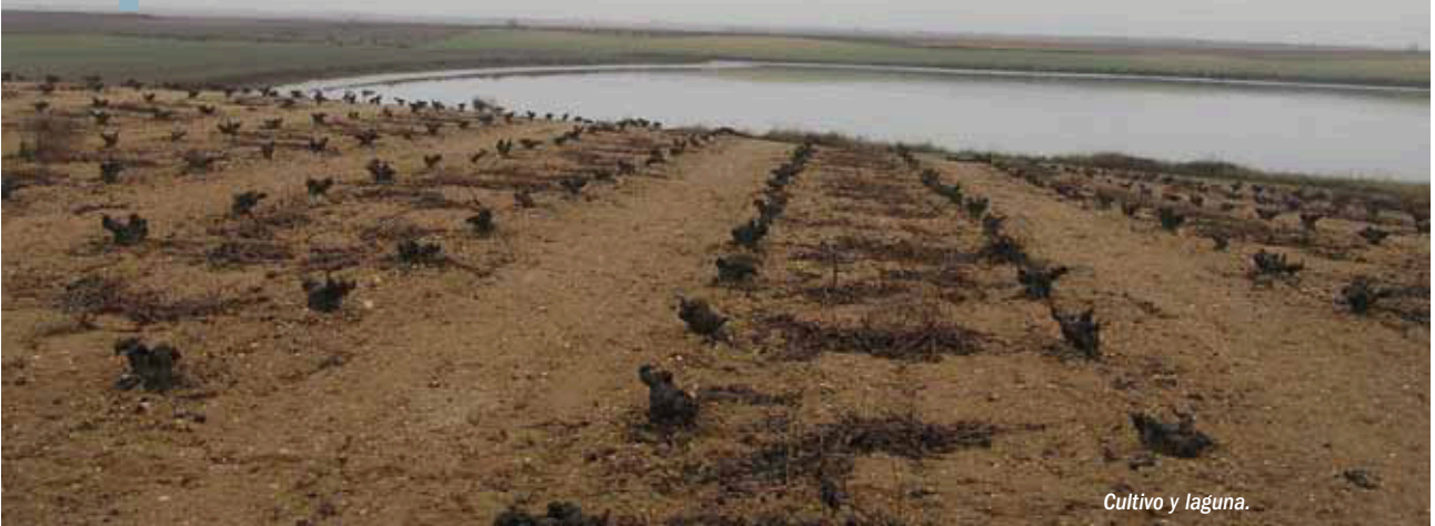
Cultivo y laguna.

La Reserva es un elemento clave para la conservación de la diversidad biológica asociada a los ecosistemas lacustres y riparios de la misma. Asimismo, juega un papel fundamental como elemento de acercamiento y colaboración de los ciudadanos y la administración en temas de conservación, ofreciendo nuevas posibilidades y propuestas para ensayar métodos de desarrollo sostenible.