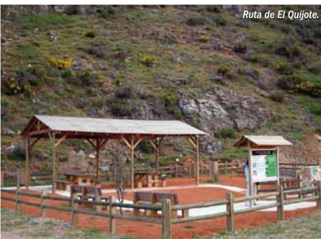
Ruta de El Quijote.

El turismo gastronómico y vinícola está muy desarrollado en la región. Los productos como el vino y el queso son el mayor atractivo para el turista. En determinadas queserías o bodegas puede conocerse el proceso de elaboración tradicional del producto.