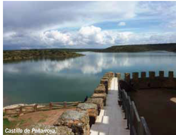
Castillo de Peñarroya.

Diversos museos y talleres artesanos muestran la riqueza etnográfica y de