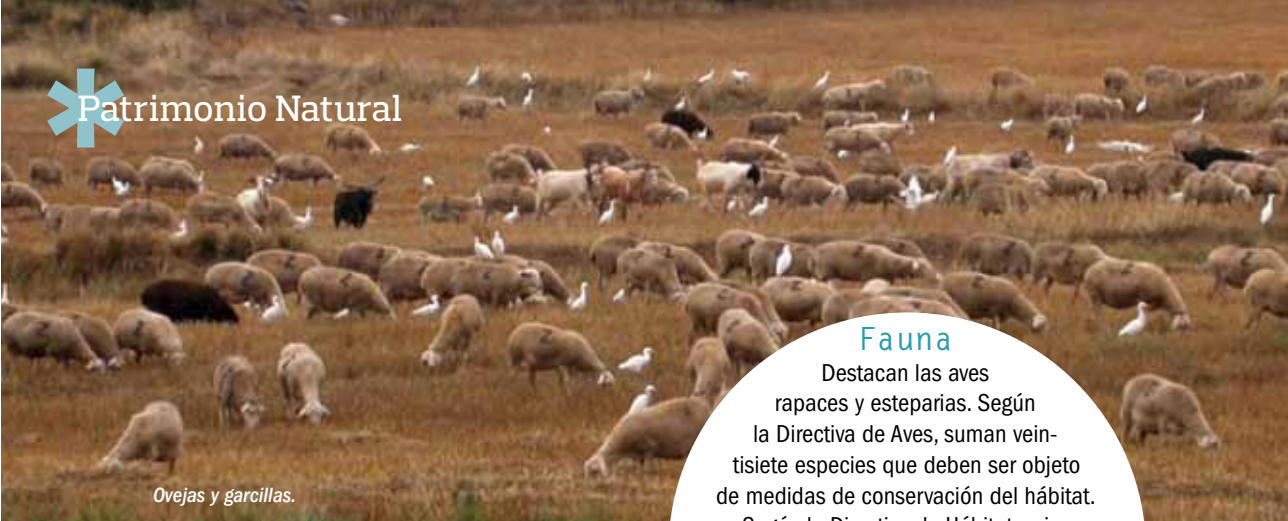
Ovejas y garcillas.