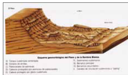
Geomorfología de la Blanca.

des “congozantes”: diecinueve pueblos, dos valles pirenaicos y un monasterio cisterciense.