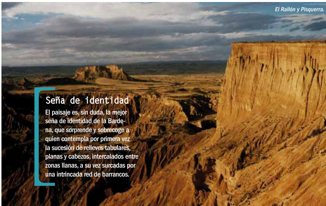
El Rallón y Pisuerra.