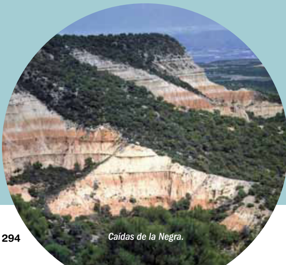
Caídas de la Negra.

Es muy gráfico observar cómo, en balsas maduras, la vegetación se presenta en círculos casi concéntricos en función del gradiente de humedad. En el interior quedan los cinturones de aneas, carrizos, juncales, praderas higrófilas y, ya fuera de la balsa y siguiendo el aumento de sales, aparecen tamarices y saladares.