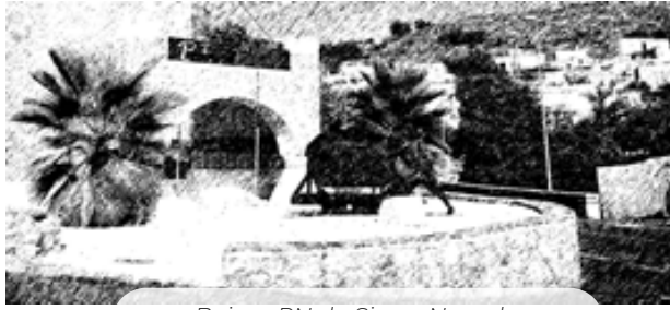
Beires. PN de Sierra Nevada

Las zonas agrícolas son las más ampliamente representadas alcanzando un 59% de la superficie total, donde encontramos principalmente terrenos agrícolas con importantes espacios de vegetación natural, cultivos de frutales y plantaciones de bayas y mosaicos de cultivos, todos ellos con extensiones similares. Más del 39% de